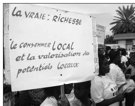
Marche populaire lors de la 3 e rencontre sur la globalisation des solidarités, Dakar 2005.