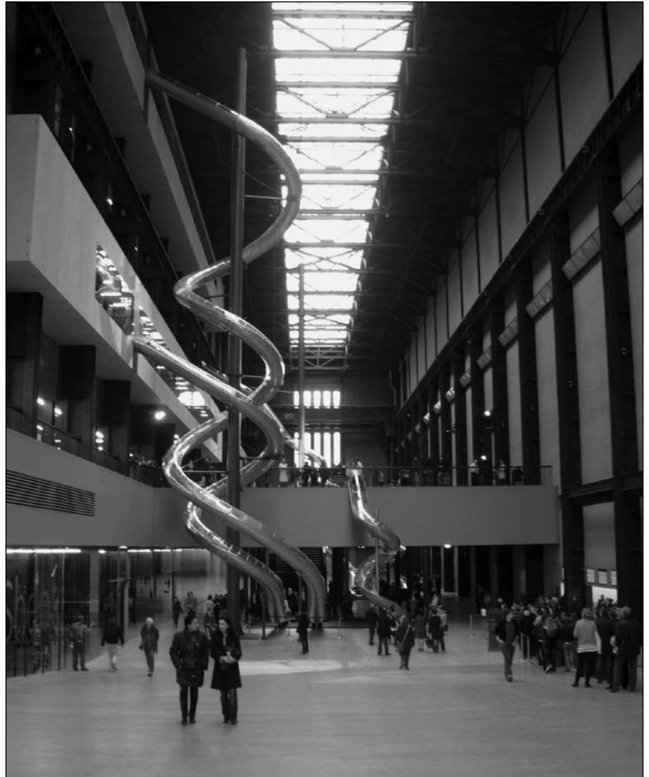
Illustration 2 : Les toboggans de Carsten Höller, Unilever Series, Turbine Hall, Tate Modern, Londres (10 octobre 2006 – 15 avril 2007).