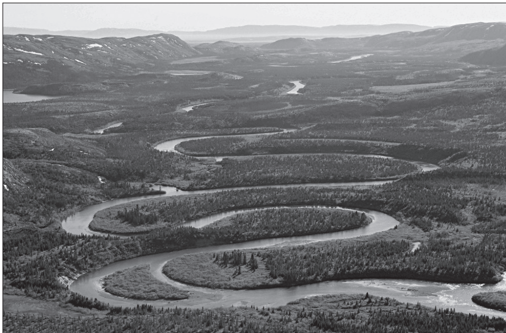
ILLUSTRATION 1 : Vue sur le Parc national Tursujuq (photo : Robert Fréchette, gracieuseté de l'Administration régionale Kativik (ARK)).

patrimonialisation et son milieu, plusieurs recherches mettent en lumière les manières par lesquelles les acteurs coconstruisent leurs représentations, les adaptent ou les remettent en question pour en créer de nouvelles (Berkes, 2004; Leroux et al. , 2007; Prangnell et al. , 2010; Ramousse et Salin, 2007).