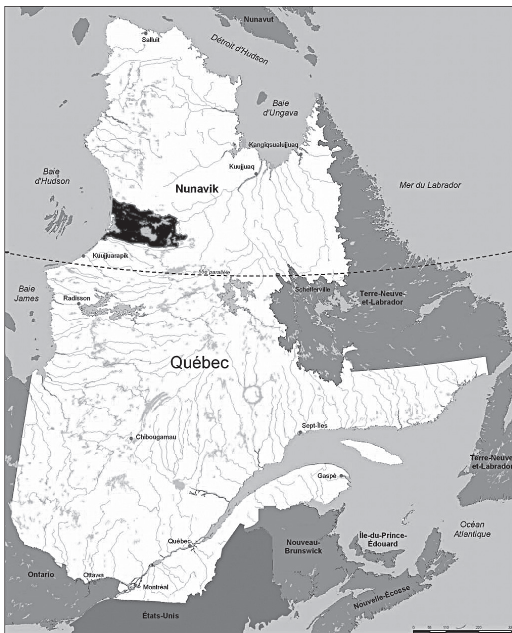
ILLUSTRATION 2 : Localisation du territoire à l'étude, projet de parc national Tursujuq (en noir, territoire à l'étude).

la population locale demeure généralement modeste notamment du fait que la décision finale reste du ressort des instances gestionnaires des parcs» (Héritier, 2010). Dans sa dimension narrative, elle constitue toutefois une scène intéressante pour explorer «les diverses représentations sociales au cœur d'un mécanisme d'appropriation» (Lepage, 1999 : 138). Bien entendu, nous ne prétendons pas que les discours auxquels nous nous sommes intéressés dans cette recherche — c'est-à-dire ceux des Inuits et des Cris venus s'exprimer à la consultation publique du 16 au 18 juin 2008 — reflètent l'ensemble de ce que la population inuite et crie du Nunavik pense à propos des projets de parcs nationaux. Néanmoins, ces discours sont intéressants pour observer, dans un temps