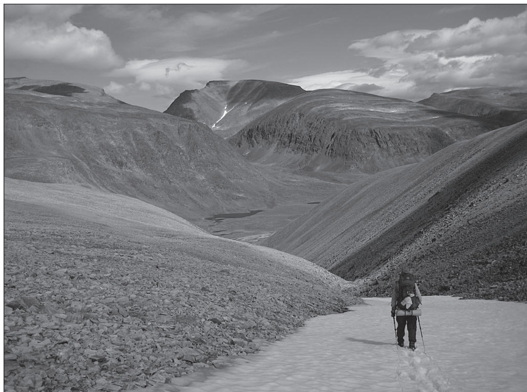
ILLUSTRATION 4 :

Point de vue sur le futur parc national de la Kuururjuaq.