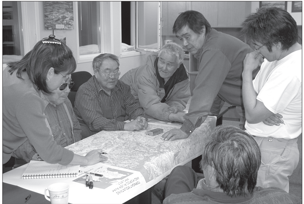
ILLUSTRATION 2 : Un exemple de consultation publique. Celle-ci était liée à la création du Parc national Kuururjuaq (photo : Josée Brunelle, gracieuseté de l'Administration régionale Kativik (ARK)).

(Hilborn et Ludwig, 1993). Dans le cas des changements climatiques par exemple, il est impossible de manipuler le climat et de faire des expériences en milieu contrôlé (Krebs et Berteaux, 2006). Il est donc impossible de confirmer avec certitude les conséquences que ces changements auront sur les écosystèmes et les espèces, ce qui complique les prises de décisions en matière de gestion environnementale (Krebs et Berteaux, 2006). De plus, les avancées scientifiques des dernières décennies tendent à montrer que les écosystèmes soumis à un stress ne changent pas graduellement, mais plutôt de manière brusque et imprévisible (Holling, 1996). C'est afin de tenir compte de ces incertitudes et de la nature imprévisible des écosystèmes que la méthode de la gestion adaptative a été proposée (Holling, 1978).