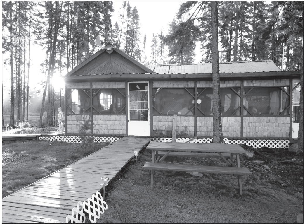
ILLUSTRATION 3 : Hébergement en pourvoirie au Québec.

pourquoi plusieurs éléments sur les commodités et services proviennent du guide des pourvoiries du Québec (FPQ, 2011) et de l'étude de Lemieux (2010). Celui-ci fait une recension des services et des commodités disponibles dans les pourvoiries membres de la Fédération des pourvoiries du Québec. De leur côté, Groome et al. (1983) traitent de l'hébergement, de l'accessibilité, des installations et des services. Pour sa part, l'étude de la Commission canadienne du tourisme (2006) porte sur les besoins des touristes en général, même si certains éléments demeurent pertinents au niveau des besoins des touristes chasseurs. Les variables proposées qui sont liées aux besoins sont énumérées dans le tableau 4.