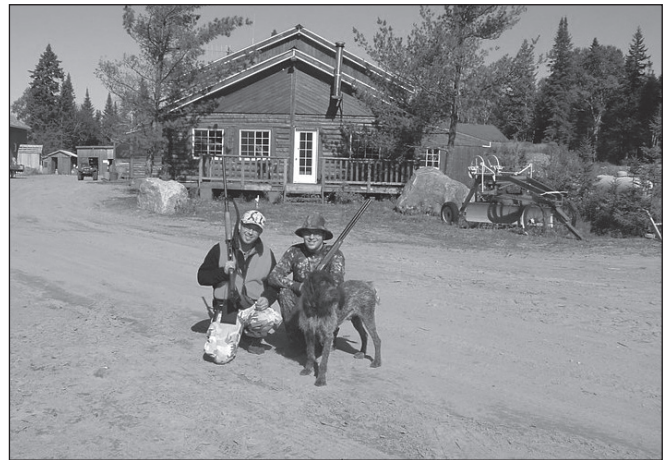
ILLUSTRATION 4 : Chasseurs de la génération Y.

Cole (1973 : 78) précise que les agences responsables de la gestion des ressources naturelles doivent maximiser la diversification des opportunités et des expériences de chasse.