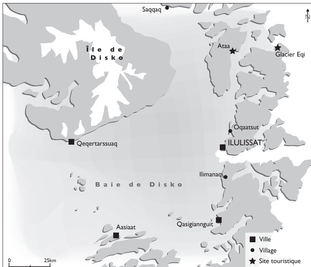
ILLUSTRATION 7 : Les fronts pionniers du tourisme.

plus qu'une spécificité groenlandaise, c'est une aspiration sociétale qui traverse le temps si l'on en croit les propos d'Éric Dardel écrits en 1952. « Blessé par la société, déçu par la facilité morale du siècle, l'homme se tourne vers la nature, vers l'exotisme, pour y chercher une réponse à son inquiétude, un complément à son incomplétude » (Dardel, 1990 : 113). N'était-ce pas ce que cherchaient déjà les artistes romantiques des XVIII e et XIX e siècles ? Pour tous les touristes, le séjour au Groenland apparaît alors comme une échapatoire. Renforcé par la déliquescence sociétale, le séjour permettrait de trouver dans la nature et dans l'authenticité les forces nécessaires pour se réconcilier avec ses contemporains et pour mieux comprendre le monde. Dans une société où les changements de situation, qu'ils soient sociaux, techniques, professionnels, s'accroissent (Rosa, 2010), le tourisme devient un excellent révélateur du désir de rupture. Alors la singularité du routard ne réside-t-elle pas davantage dans l'opposition plus marquée à un modèle de société que dans les formes mêmes d'une expérience touristique ?