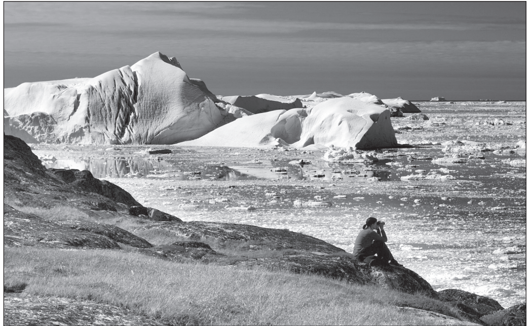
ILLUSTRATION 2 : Les paysages du froid focalisent l'attention des touristes.

le monde et tente de multiplier ses expériences afin d'accroître sa connaissance matérielle de l'espace géographique.