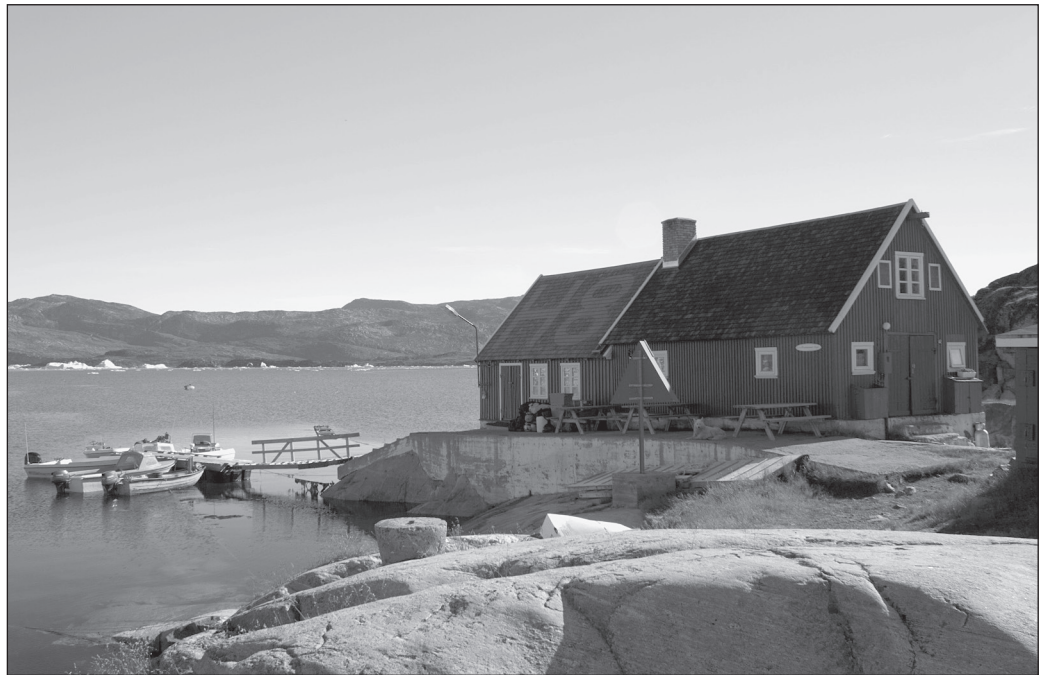
ILLUSTRATION 6 : Le restaurant H8 du village d'Oqaatsut.