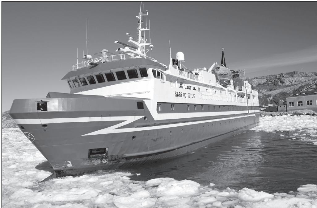
ILLUSTRATION 3 : Le navire Sarffak Ittuk dans le port d'Ilulissat.

temporelle et nous insère dans la flèche du temps, il interpelle notre appartenance à l'espace. À cette considération décontextualisée des mondes polaires s'en ajoute une autre, plus spécifique à ces espaces sauvages et vierges de toute empreinte humaine. L'attrait que ces derniers exercent en nous renvoie aux affres de la culture occidentale qui aurait perdu le lien à la Terre. Le séjour au Groenland devient alors un moyen d'exorciser cette perte et de rétablir la relation entre l'humain et l'espace géographique.