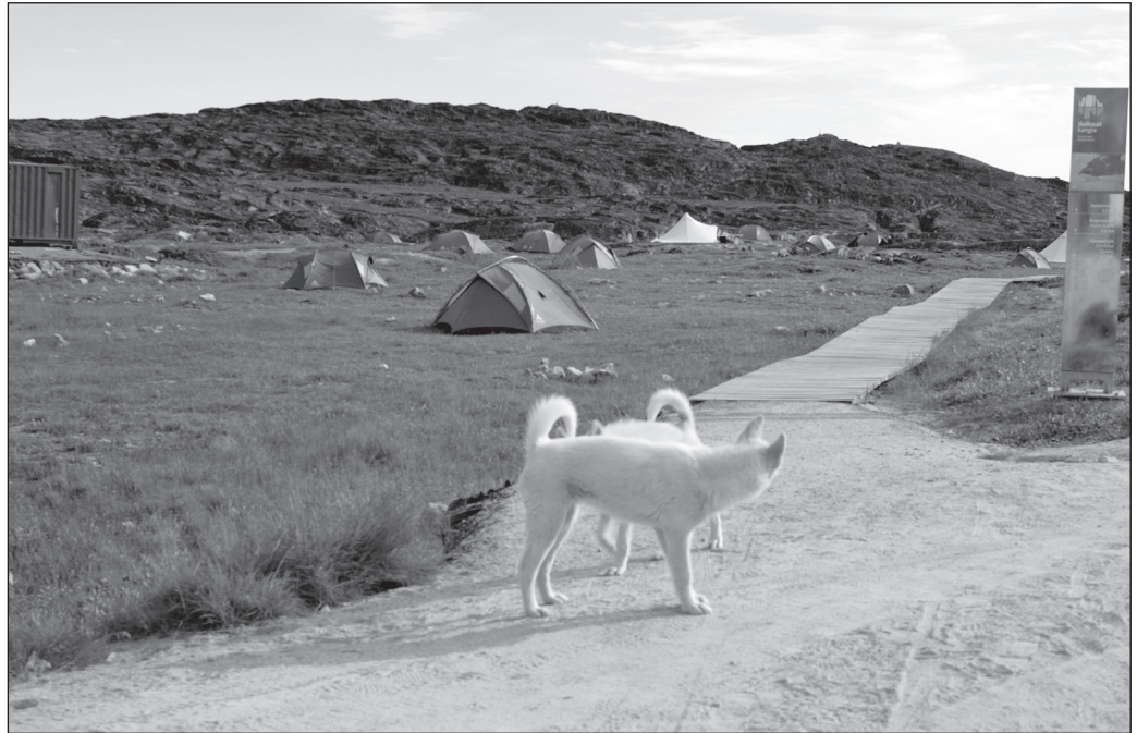
ILLUSTRATION 4 : Le camping d'Ilulissat à l'entrée du site classé par l'UNESCO.

pratique cadre de la vie sociale locale — sont autant d'expériences à fuir en raison de leur institutionnalisation. Rien n'est plus contradictoire entre une entrevue organisée et l'envie de découvrir l'authenticité de l'île. Alors, les routards tentent de provoquer la rencontre, celle-là même qui leur permettra de partager un vrai moment avec les locaux. Certains sollicitent sans succès les pêcheurs pour effectuer une sortie en mer. Cependant, à la barrière linguistique se juxtapose une contrainte réglementaire. Officiellement pour des raisons de sécurité et inévitablement pour préserver l'activité des capitaines de bateaux touristiques, il est interdit aux pêcheurs d'emmener des visiteurs.