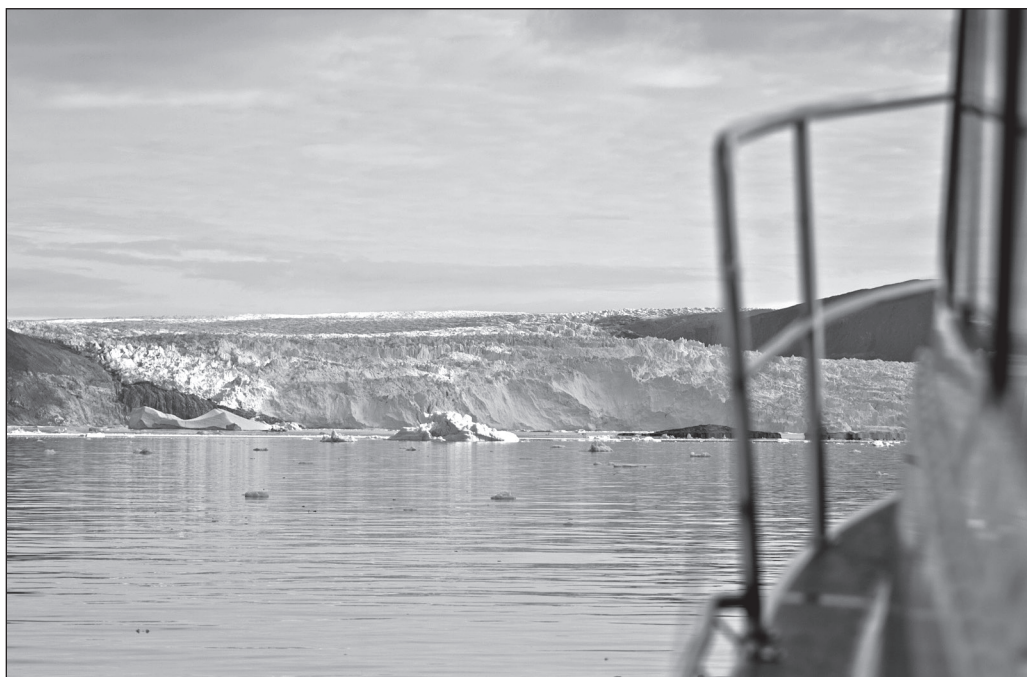
ILLUSTRATION 5 : Front du glacier Eqip Sermia.

Quand je suis venue pour la première fois, en 2002, il y avait beaucoup plus d'infrastructures pour les campeurs. Aujourd'hui il n'y a rien. C'est vrai, notre venue rapporte moins d'argent que les croisiéristes ou les touristes qui utilisent les hôtels, donc ça se comprend. Nous sommes moins intéressants. Dans les brochures il y a pourtant des touristes qui campent, qui randonnent dans la nature, mais en réalité il n'y a rien pour nous. Pas d'eau. Pas de toilettes.