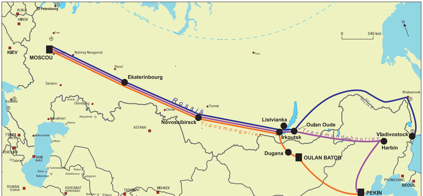
ILLUSTRATION 1 : Les parcours du Transsibérien et leurs principales étapes.

sur l'histoire de la construction de la ligne et de son évolution dans le temps (Senin, 2001; Remencov, 2003; Mosse, 2001). Les ouvrages russes font souvent appel à l'importance économique et stratégique de ce chemin de fer pour la Russie en étudiant principalement son rôle dans la communication entre la partie européenne du pays et l'Asie orientale (Durakov, 2007; Uhtomin, 2005). Il existe également un grand nombre de récits en français (Bellec, 2008; Dunbar, 2006; Thomas, 2005) consacrés au voyage à bord de ce train qui contribuent à la popularité de ce produit touristique parmi la clientèle française, francophone et francophile. Néanmoins, ces études consacrées au Transsibérien en tant que moyen de transport ou en tant que train-légende négligent souvent son rôle dans le développement des nouvelles destinations touristiques. Comme nous le verrons dans cet article, le Transsibérien est un élément fondamental dans le cadre de l'étude d'un pays comme la Russie : il relie la Russie européenne à l'Asie orientale. De ce fait, le train a créé un certain nombre de lieux touristiques et continue à le faire.