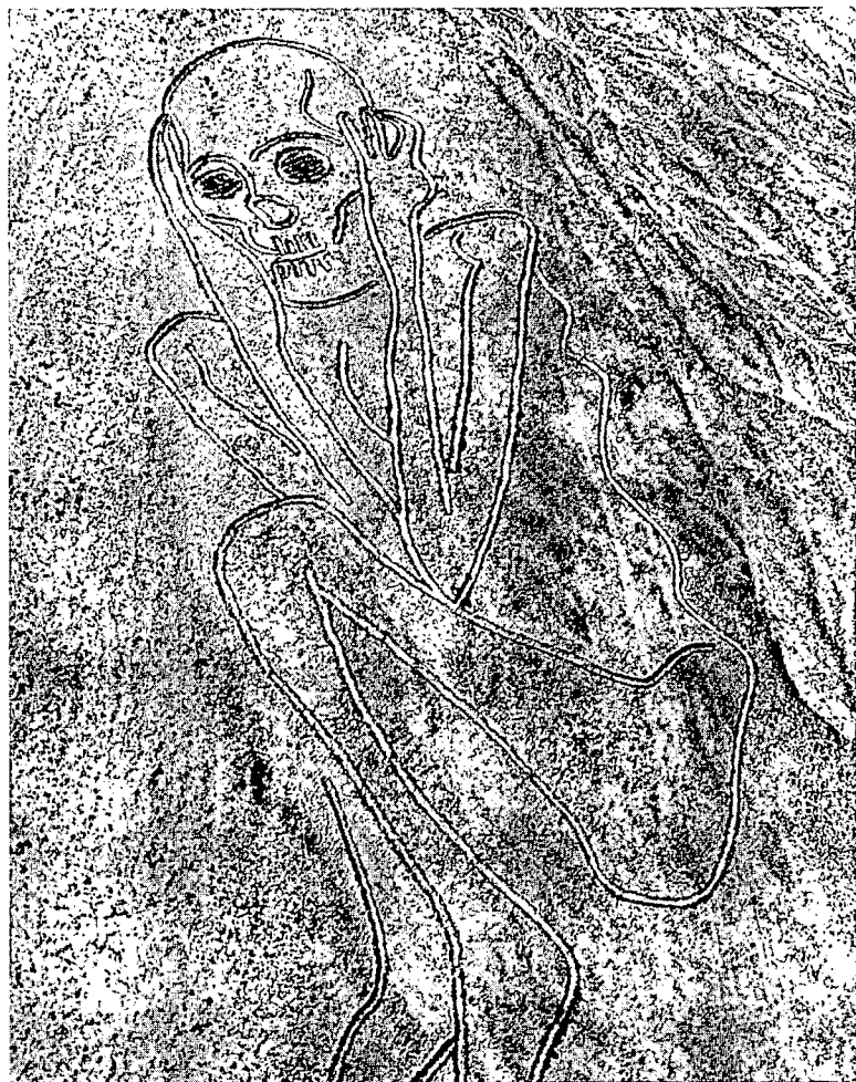
Momia , no. 2, novembre 1986, 100x100m Grattage du sable de surface avec mise en place de pierres aux bords (vue aérienne)