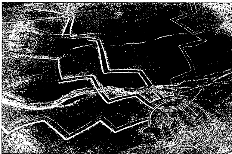
Zig Zag God , novembre 1985, 100x100m Grattage du sable de surface avec mise en place de pierres aux bords (l'eau qui dévale de la Cordillère des Andes) Nazca, Pérou.