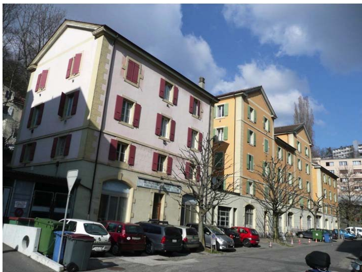
Figure 1. Le quartier du Vallon, un ensemble d'habitations ouvrières.

Si l'on se réfère aux modèles classiques de la gentrification – le rent gap (Smith, 1984 ; Hamnett, 1996) et le life style choice (Ley, 1996) –, tous les ingrédients sont réunis pour faire de cette portion de ville un site propice à une réhabilitation à destination des classes moyennes-supérieures. Du point de vue identitaire, l'image du Vallon se transforme : il devient un « espace-signe » attractif pour des populations désireuses de se démarquer par leur style de vie et qui souhaitent bénéficier d'une localisation centrale. Du point de vue économique, l'existence d'un différentiel très favorable entre la valeur du marché et la valeur potentielle des biens immobiliers présents dans le quartier garantit la rentabilité des investissements potentiels.