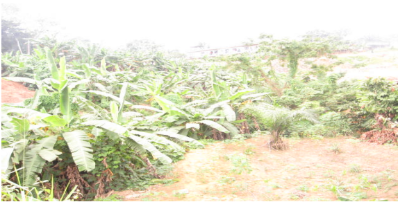
Figure 6. Champ de bananiers dans un bas-fond à Cocody près du Lycée technique (Olahan, 2009)

toutes sortes de terrains (terrains à bâtir non aménagés, terrains publics inexploités et laissés vacants, terrains d'habitation, terrains physiquement non aménageables (Mougeot, 1995). Ce dernier type de terrains, qui n'intéresse pas l'autorité compétente en la matière, fait, cependant, l'objet d'occupation en matière d'agriculture urbaine par les acteurs, malgré les risques potentiels et avérés qu'ils encourent (figure 6). Car, celle-ci (l'agriculture urbaine) ne fait pas obstacle à un aménagement plus approprié du territoire urbain, mais permet au contraire d'exploiter des endroits petits, inaccessibles, non viabilisés, dangereux ou inoccupés (Mougeot, 2006). L'espace, ici, est dévolu le plus souvent à la culture des vivriers (banane plantain, manioc, maïs,...) et des maraîchers comme les feuilles de laitue (salade), les carottes et le chou. De même, du fait que le planificateur ne s'intéresse pas à ce type de terrain dans le tissu urbain, celui-ci connaît une certaine stabilité ou de perpétuité dans son exploitation.