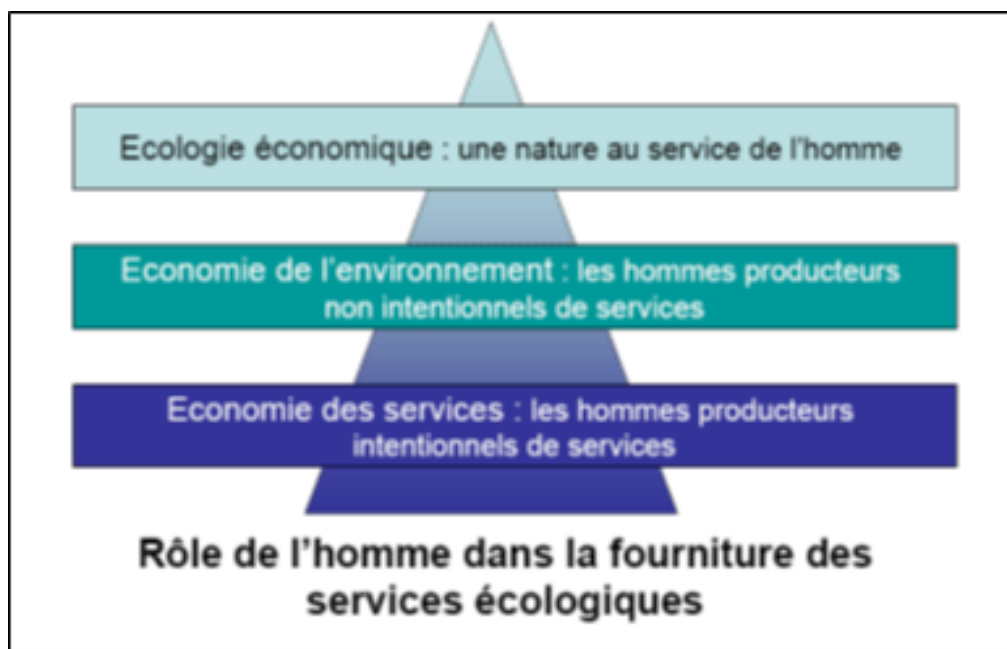
Figure 2. Différentes perceptions de la notion de SE en économie (inspiré de Aznar et Pierret-Cornet, 2003)

13 Si ces controverses associées à la notion de service écosystémique sont aussi fortes, c'est parce qu'elles renvoient à des divergences plus profondes sur les valeurs intrinsèques des individus et des collectifs vis-à-vis de l'environnement. Le mot « valeur » est ici entendu comme étant ce qui donne sens, oriente et justifie les actions individuelles et collectives (à distinguer des débats sur la "valeur" attribuée aux SE que nous allons évoquer dans la section suivante). Certains travaux d'éthique environnementale ont ainsi montré que la préservation à long terme de l'environnement relève de valeurs et de motivations soit « égoïstes » (conserver la nature pour soi), soit « altruistes » (conserver la nature pour les autres), soit « biocentrées » (conserver la nature pour elle-même) (Stern and Dietz, 1994). On retrouve ici les débats associés aux différentes conceptions de la notion de services écosystémiques évoqués précédemment.