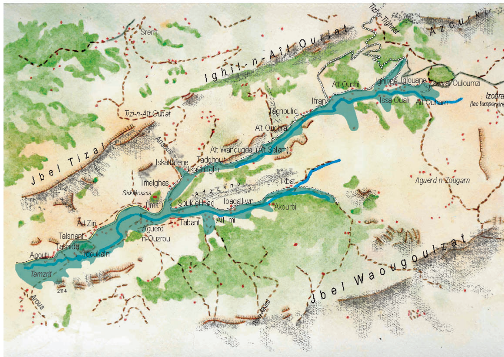
Figure 2. Carte schématique des Aït Bou Guemez () / Sketch-map of the Aït Bou Guemez valley (Liliane Dumont)