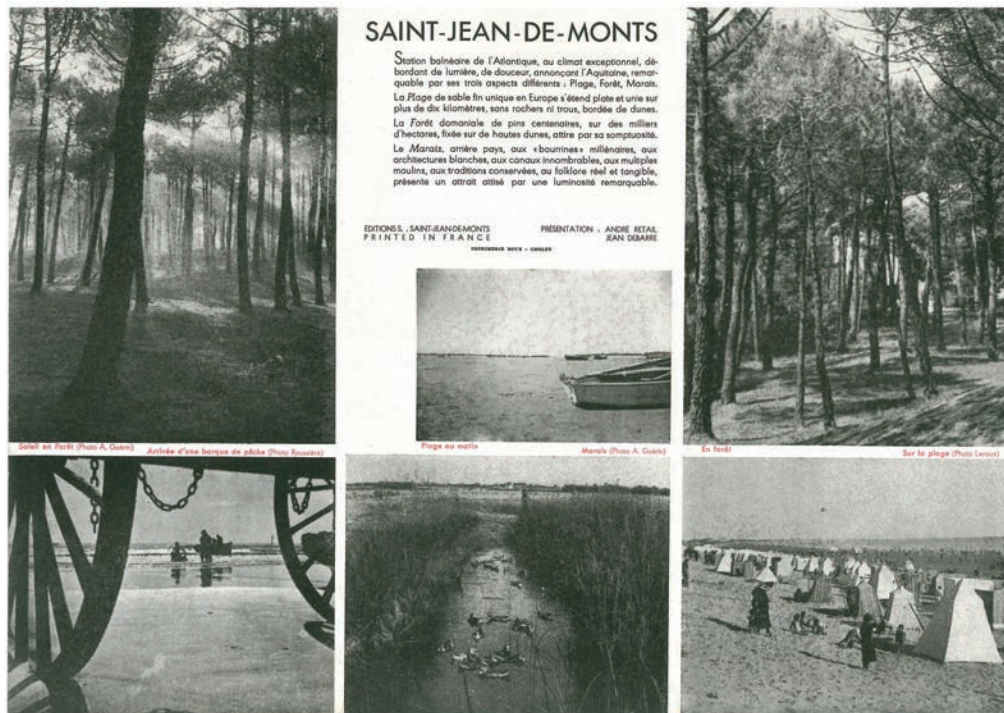
Figure 4. Dépliant touristique de Saint-Jean-de-Monts, à la fin des années 1940.