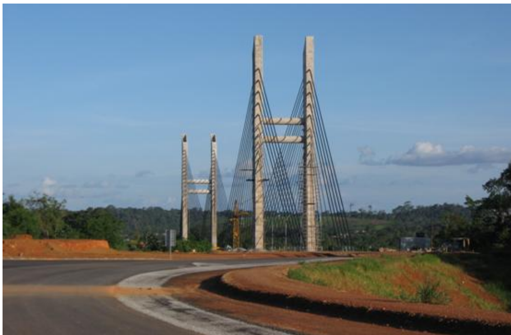
Figure 4. Le pont sur l'Oyapock et sa route d'accès sur la rive française / The bridge over the Oyapock and its access road on the French side.