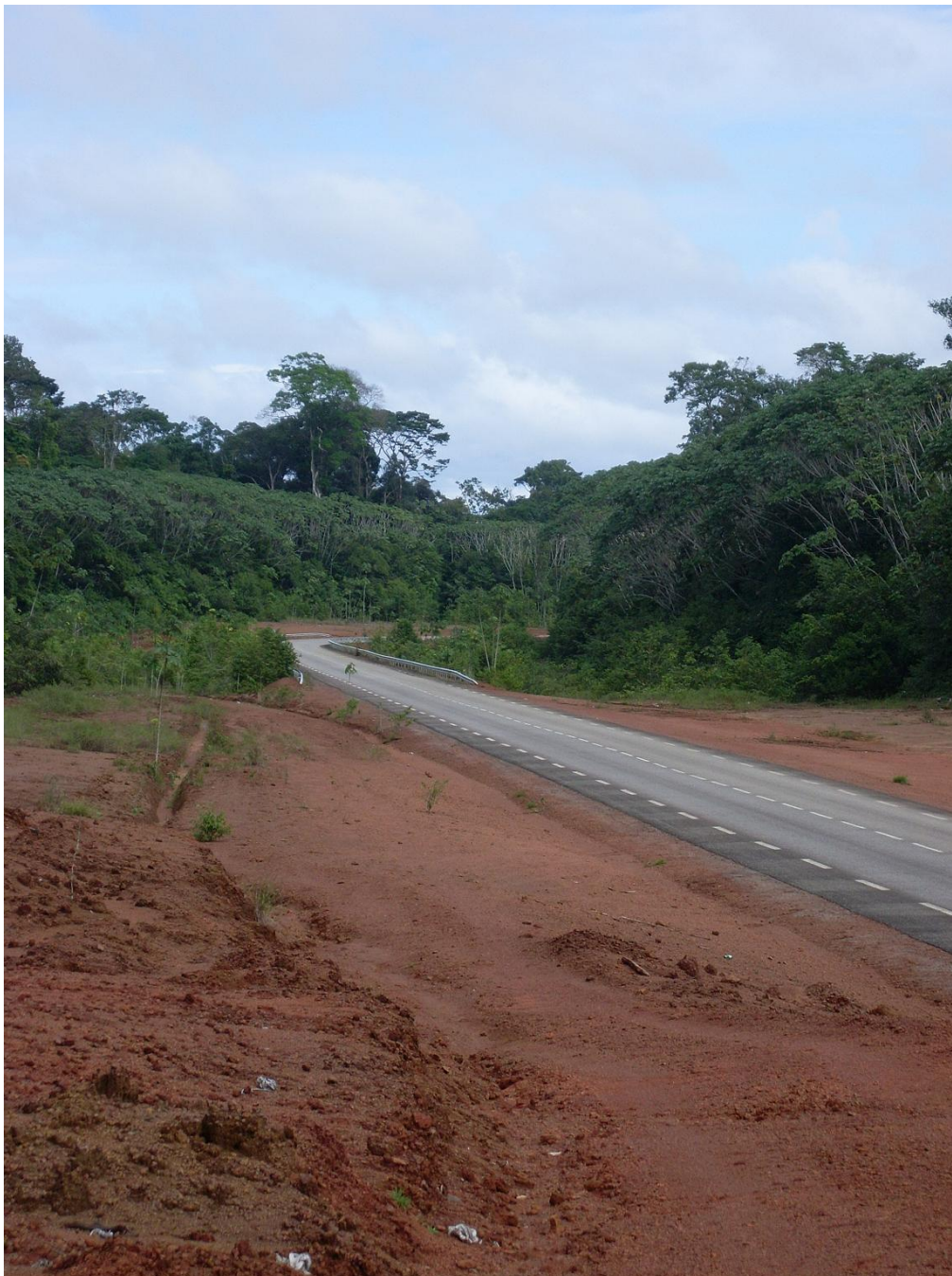
Figure 2. Portion de route entre Régina et Saint-Georges /Part of the road between Regina and Saint-Georges