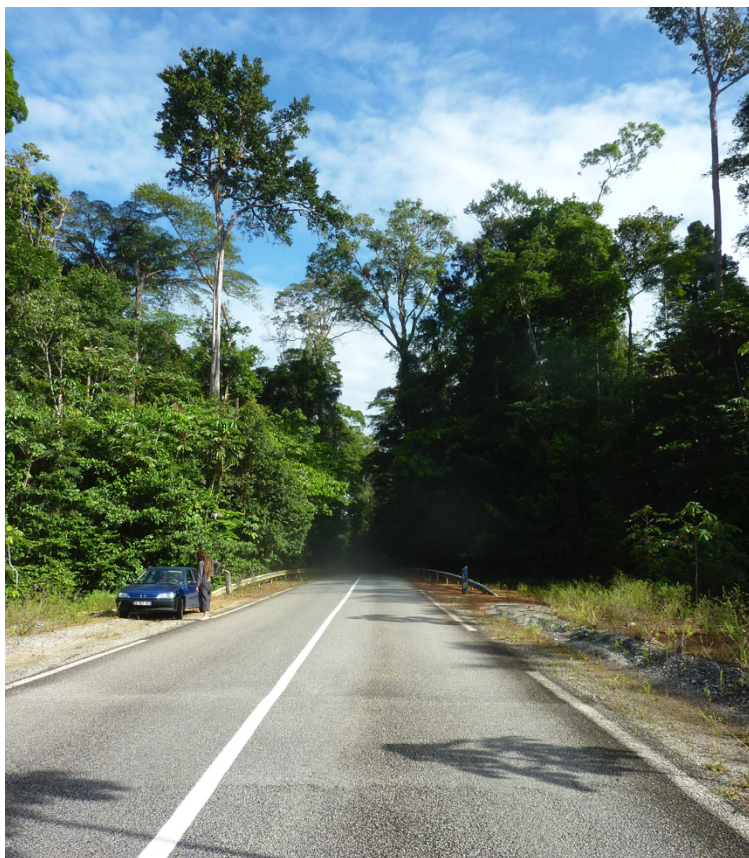
Figure 3. Entrée d'un corridor écologique / Entry of an ecological corridor