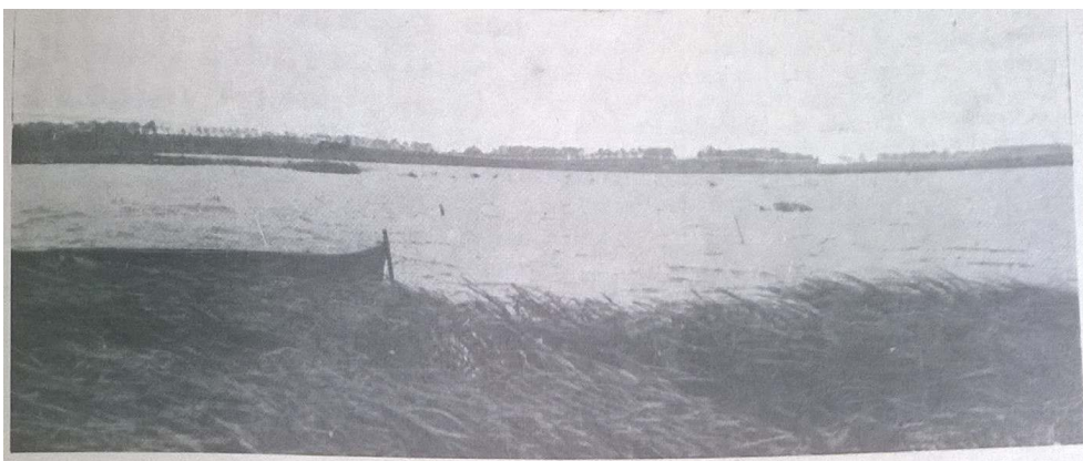
Figure 2. Le marais d'Harchies en 1949 / Swamp of Harchies in 1949.

La propriété terrienne , 22, octobre 1949, pp. 262.