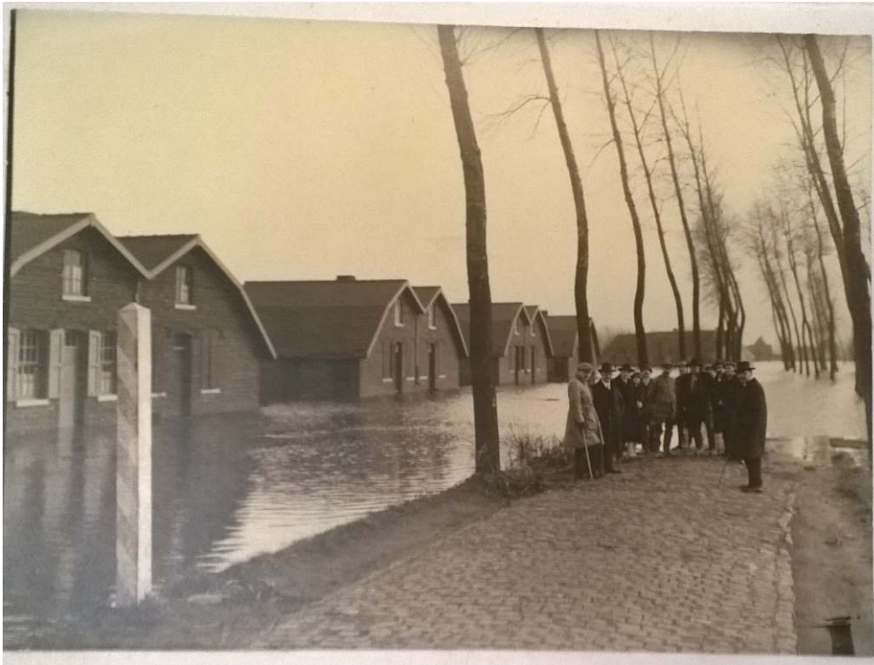
SAICOM, Archives des charbonnages d'Hensies-Pommeroeul, 606.