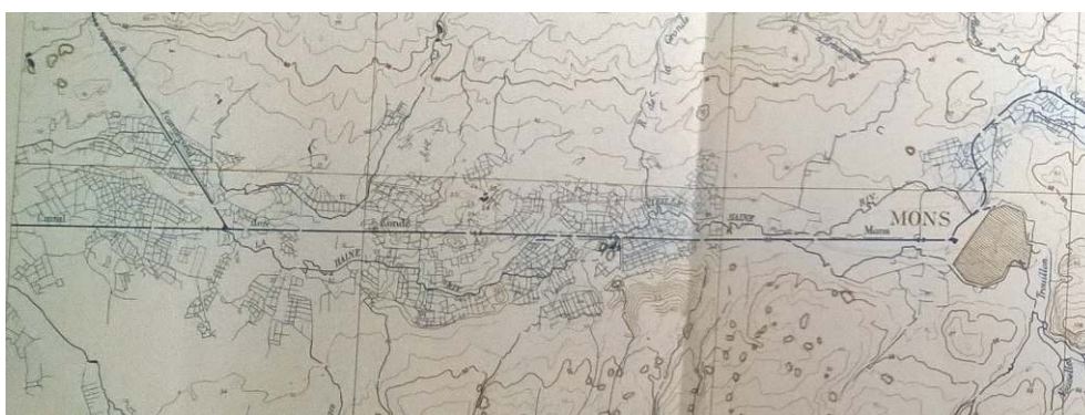
Figure 1. Carte de la vallée de la Haine inférieure en 1938.

Carte au 100000 e de la vallée de la Haine inférieure en 1938. On observe bien en aval de Mons les nombreuses rigoles d'irrigation construites par les wateringues. Map at 100000 th of the Lower Haine Valley in 1938. We see downstream Mons many irrigation channels built by the « wateringues »