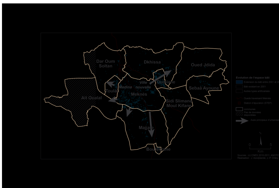
Figure 2. Évolution de l'espace bâti dans la zone d'étude (ville de Meknès et communes périphériques).