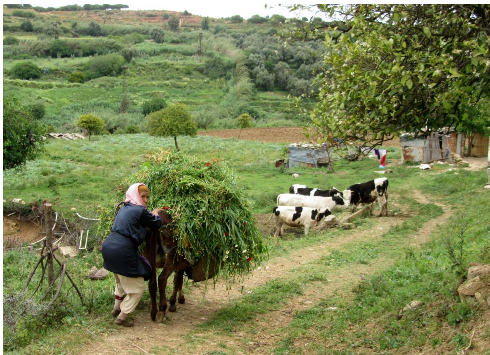
Figure 7. Agriculture familiale dans une des 3 vallées traversant l'agglomération de Meknès, la campagne dans la ville.

les petits agriculteurs melkistes, ils contribuent pourtant à approvisionner la ville en céréales, légumineuses à graines et en produits périssables (légumes, lait) (Dugué et al., 2015). Ces agriculteurs périurbains qui peuvent perdre leur accès à la terre dès que leur propriétaire souhaite vendre la terre, sont de fait les grands perdants de cette course au foncier puisqu'aucun dispositif légal d'indemnisation n'est prévu pour eux (les locataires, les métayers) si ce n'est une indemnisation au bon vouloir des propriétaires et symbolique par rapport au prix réel du terrain à bâtir.