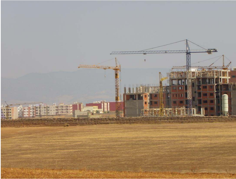
Figure 4. Urbanisation dans la commune de Sebaâ Ayoune par mitage des champs : la ville à la campagne.