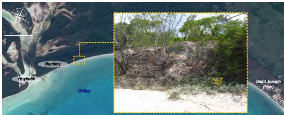
Figure 3. Paysage actuel de Banbiny.

« A Banbiny, le nom ça signifie les monticules de sables. Des dunes qui étaient aussi hautes que des maisons [...] » Homme de 68 ans, de la tribu de Takeji.