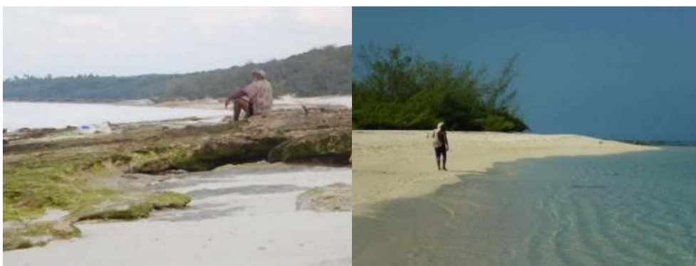
Figure 2. Hommes kanak scrutant l'océan depuis Cöu (photographie de gauche), depuis Gööny (photographie de droite) / Kanak man watching the ocean.