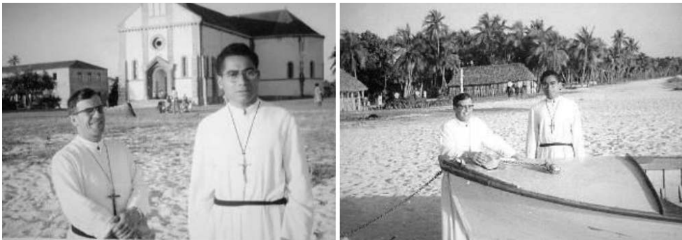
Figure 4. Photographies d'archive de la plage face à l'église de Saint-Joseph, Héo.