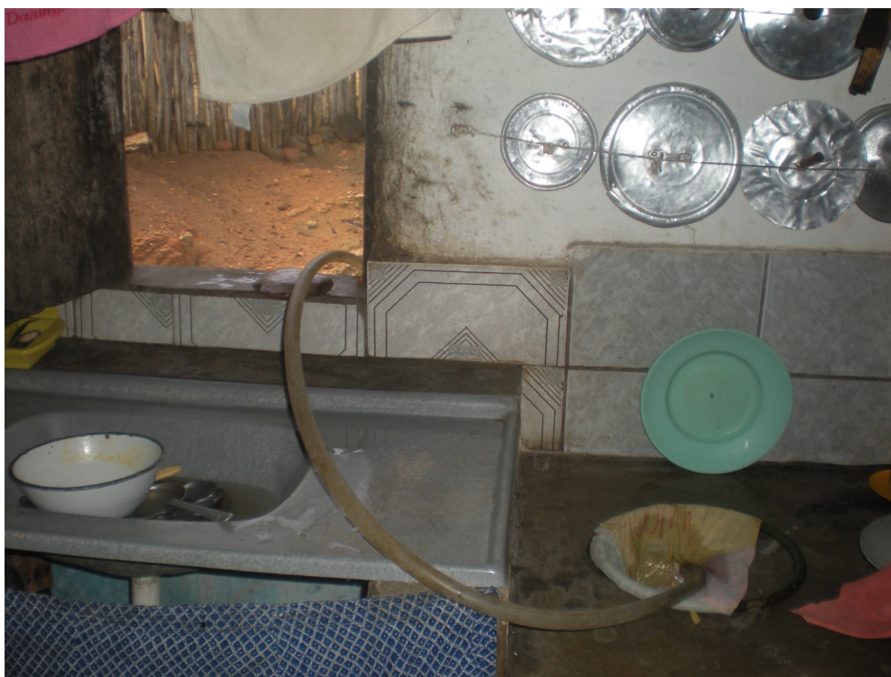
Figure 3. L'alimentation en eau vu de l'intérieur.

À défaut d'installer un système de canalisation à l'intérieur de la maison, le tuyau permet de remplir le réservoir de la cuisine. L'eau sera ensuite prélevée manuellement pour faire la vaisselle, remplir les casseroles d'eau de cuisson ou encore nettoyer les aliments.