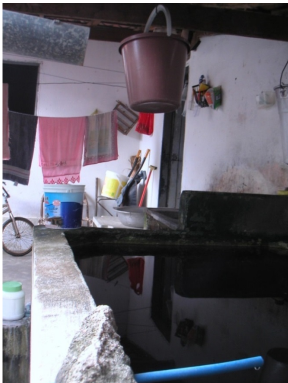
Figure 5. Bassin construit au sein de l'espace domestique.

Le bassin est rempli avec l'eau du robinet grâce au tuyau bleu fixé par une pierre, et avec l'eau de pluie acheminée par une gouttière métallique. L'eau est ensuite puisée avec le seau en plastique accroché au-dessus du bassin.