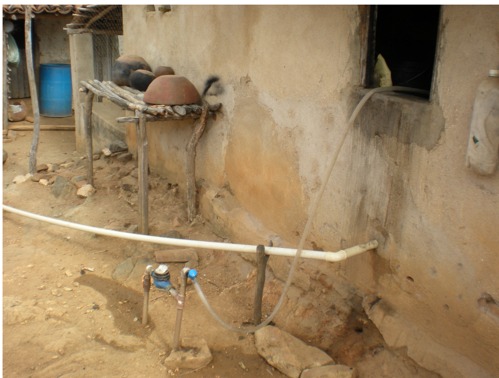
Figure 2. L'alimentation en eau vu de l'extérieur.

Le compteur d'eau individuel est placé dans l'arrière-cour de la maison. Un tuyau de raccordement est passé par la fenêtre de la cuisine pour adapter le dispositif aux usages domestiques. Une canalisation (blanche) permet de récupérer les eaux de vaisselle pour arroser plus loin quelques plantations.