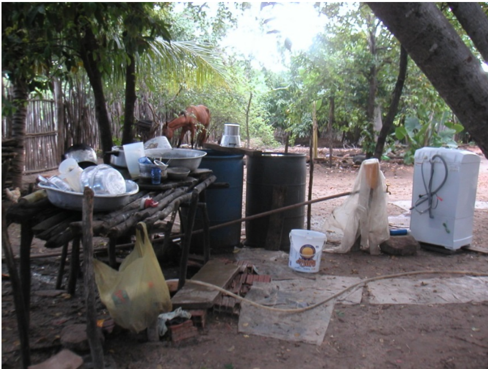
Figure 6. Photo de l'aménagement d'une arrière-cour.

La photo illustre une structure en bois installée pour nettoyer la vaisselle, et une machine à laver raccordée au réseau d'eau domestique. Le tuyau (au premier plan) sert à remplir les bidons en plastique en saison sèche et à rincer la vaisselle.