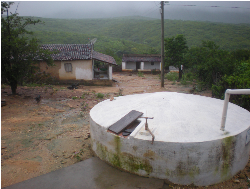
Figure 4. Photo d'une citerne d'eau de pluie financée par l'Asa-Brasil.

La pompe manuelle permet d'extraire l'eau de la citerne. En cas de panne, l'eau est directement puisée avec un seau via la trappe.