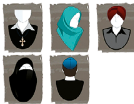
Image tirée du projet de loi 60, Charte affirmant les valeurs de laïcité et de neutralité religieuse de l'État ainsi que d'égalité entre les femmes et les hommes et encadrant les demandes d'accommodements, déposé en 2013 par le Parti québécois.

Exemples de signes ostentatoires qui ne seraient pas permis au personnel de l'État.