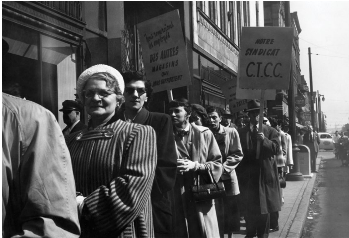
La grève du grand magasin Dupuis Frères, 1952, Montréal.

Le Conseil central du Montréal métropolitain – CSN (CCMM-CSN) est reconnu comme une organisation syndicale militante, combative et solidaire, toujours présente au cœur des luttes politiques et sociales. Son influence sur la vie politique montréalaise et québécoise au cours du XX e siècle est indéniable et se poursuit aujourd’hui. Pour souligner son 100 e anniversaire, nous proposons un rapide survol de son histoire 1 .