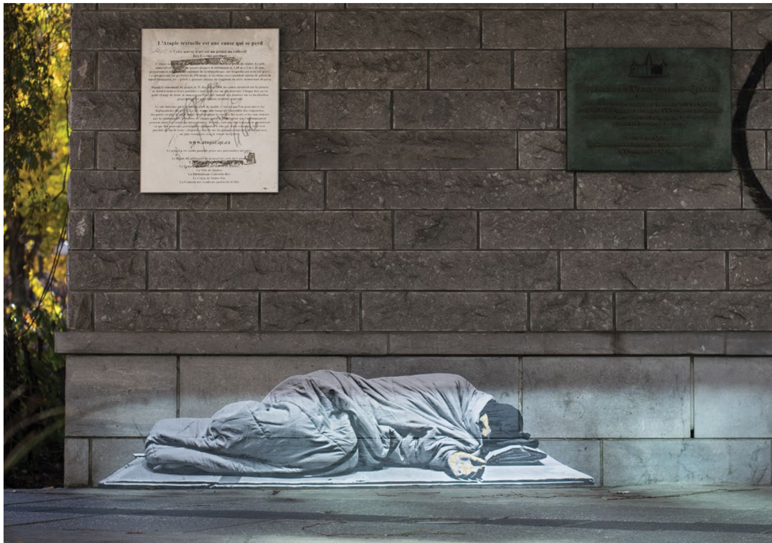
Graffiti sur la place de l'Université-du-Québec, Québec.