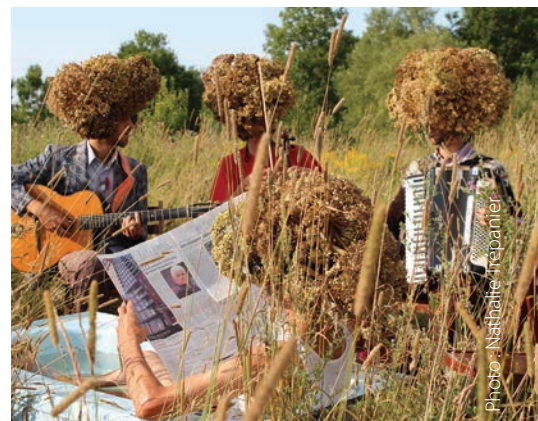
Deux scènes du Semeur : la procession du haricot Saint-Sacrement et la performance « Semer l'angélique »

traiter comme un archétype, un héros du quotidien, sans qu'il soit lié de façon anecdotique aux autres. Je préférerais l'évocation à l'explication. Quand on tombe dans l'explication, on sort de la métaphore et du mystère. Or, je préfère les zones d'ombres. C'est ce qui maintient l'intérêt. Combien de fois nous dit-on que si l'on ne précise pas telle ou telle chose, les gens ne comprendront pas? En fiction on n'explique pas tout, pourquoi devrait-on le faire en documentaire? Si l'on se contente de nourrir le spectateur en lui disant ce que ça goûte, on ne lui laisse pas la possibilité de dire ce qu'il goûte.