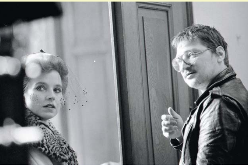
Rainer Werner Fassbinder en compagnie d'Hanna Schygulla sur le tournage du Mariage de Maria Braun