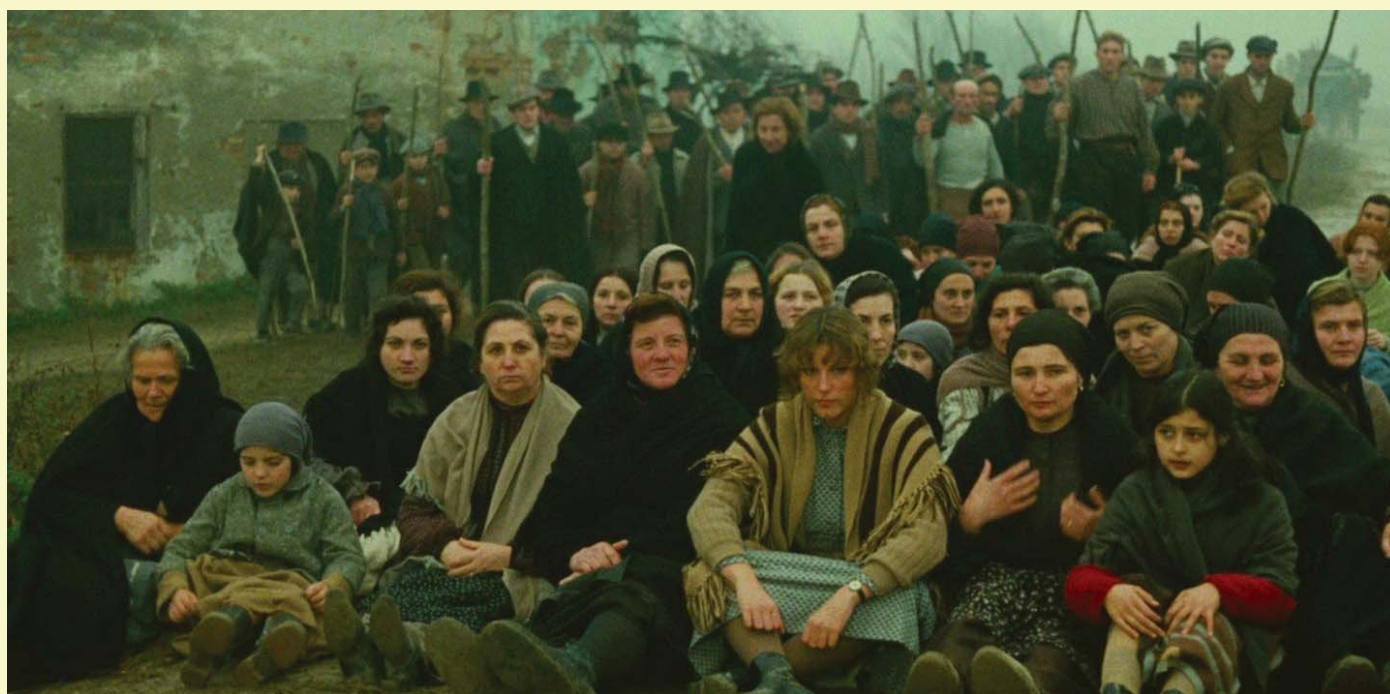
Scène de résistance : des femmes bloquent l'avancée de la cavalerie dans 1900.