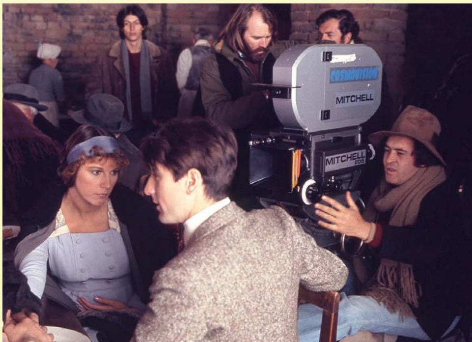
Bernardo Bertolucci sur le tournage de 1900

jalousie et de désir, traverse le film. Lequel est construit pour amener le spectateur à adhérer au combat des ouvriers jusqu'à s'identifier à eux; si bien qu'au moment de la Libération, il ne sera guère étonné qu'Olmo-Depardieu le regarde, dans une