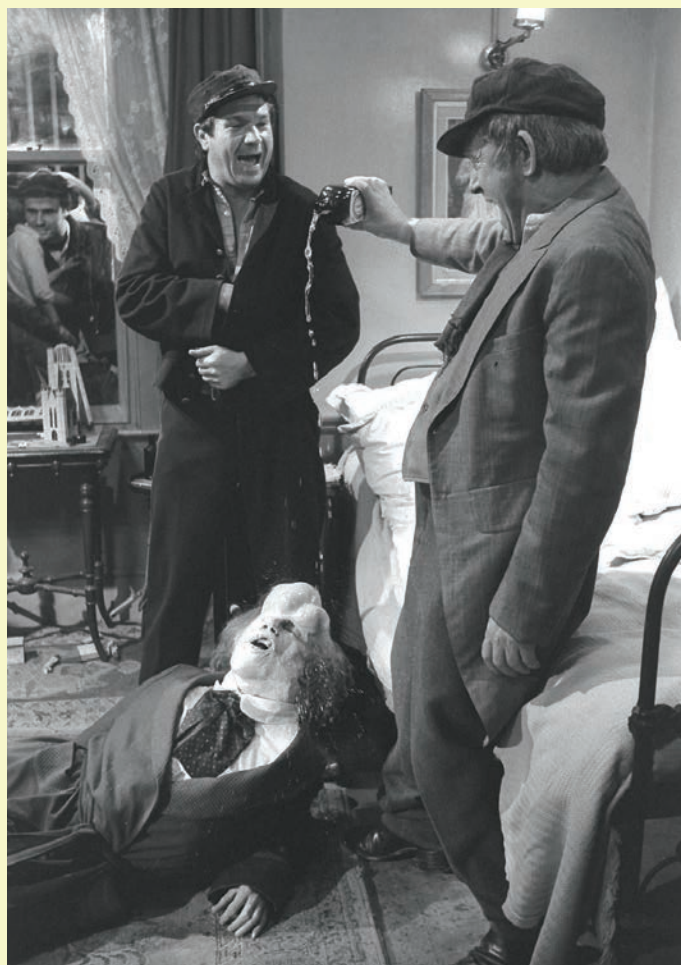
John Merrick maltraité

mouvements picturaux de la première moitié du XX e siècle, le cinéaste étant avant tout un peintre. On discerne en particulier l'influence des artistes expressionnistes et surréalistes. Le décor industriel devenu cauchemardesque évoque les peintures d'Otto Dix, qui partageait avec Lynch une vision très négative de l'urbanité. L'allure que prend Merrick, lorsqu'il revêt la cagoule qui lui dissimule le visage, rappelle l'étrange aspect des Amants (1928) de René Magritte, alors que son visage ressemble aux Autoportraits de Francis Bacon. Cependant, le passage au médium filmique est une occasion pour Lynch de dévoiler sa formidable cinéphilie. Elephant Man rend ainsi hommage à Abel Gance, Fernand Léger, Fritz Lang, Alfred Hitchcock, Maya Deren et Stanley Kubrick, entre autres. Sa direction photo en noir et blanc, remplie de jeux de vapeur et de surimpressions, est une ode au cinéma des premiers temps, en particulier à l'expressionnisme allemand. Lynch commence d'ailleurs son film sur des images de fête foraine ou de carnaval, comme c'est le cas de plusieurs films expressionnistes, dont Le Cabinet du docteur Caligari (1920). De même, il se permet de revisiter « à l'envers » la célèbre scène des escaliers de Nosferatu (1922). Lorsqu'une infirmière doit apporter son repas à Merrick, qui vient de s'installer à l'hôpital, elle est