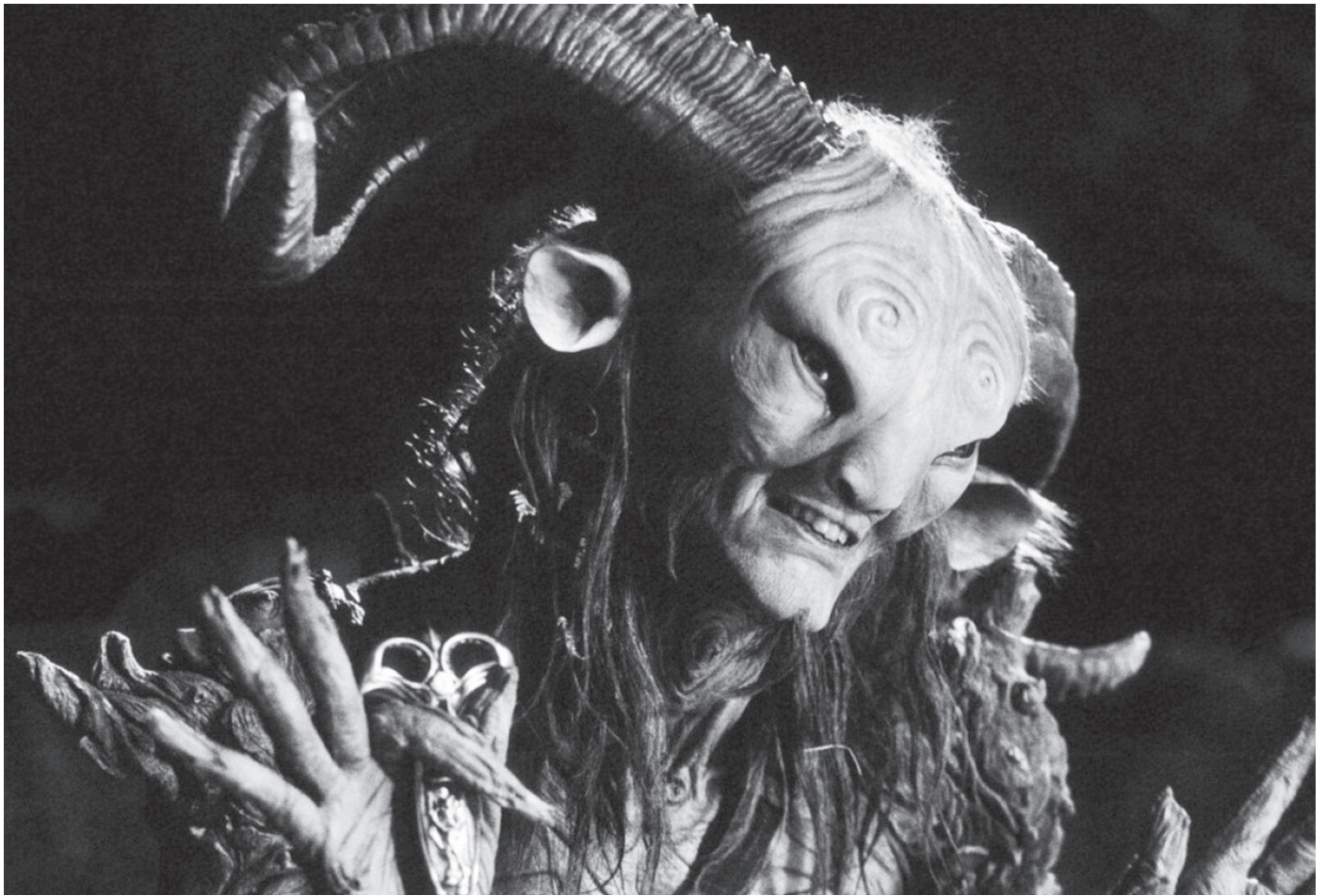
Le Labyrinthe de Pan

aux lendemains de la révolution —, Le Labyrinthe de Pan déçoit un peu par la trop grande proximité qu'il entretient avec le conte traditionnel. Les personnages y sont soit entièrement purs, soit absolument mauvais; la nuance et l'ironie manquent à l'appel.