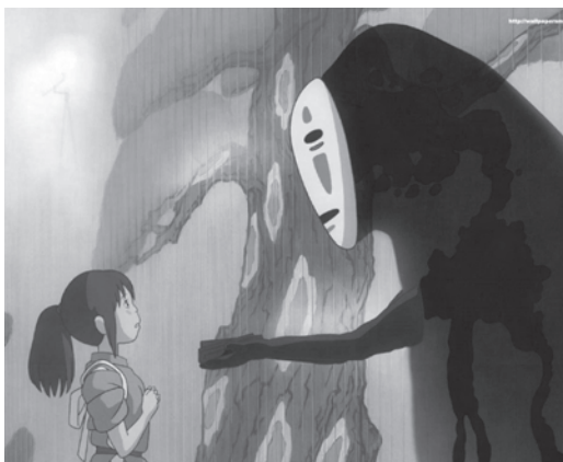
Le Voyage de Chihiro

Depuis qu'il existe, le cinéma a toujours partagé avec le conte une intimité certaine: celle des histoires qu'on écoute (ou regarde) dans le noir, et qui séduisent ou terrifient par la crudité des tabous qu'ils évoquent. Certes, les variantes issues de l'écurie Disney ont beaucoup fait pour gommer cet aspect horrifique. Et pourtant, dans un conte, il suffit qu'une donzelle innocente ouvre une porte interdite pour qu'elle se trouve devant l'alignement des épouses assassinées de Barbe Bleue. Il suffit, encore, que le lecteur se rappelle la moralité du Petit chaperon rouge de Perrault pour que le grand méchant loup de l'histoire montre ses couleurs, celles de ces prédateurs à forme humaine.