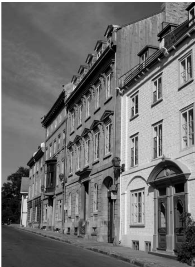
Le programme de restauration des bâtiments patrimoniaux, mis sur pied par la Ville de Québec avec le ministère de la Culture, des Communications et de la Condition féminine, est l'une des études de cas présentées.

des arrondissements historiques dans les années 1960 a tranquillement bousculé cette conception. Certes, la tentative de mettre en valeur les quartiers anciens pour en faire des musées à ciel ouvert a perpétué l'ancienne tendance, qui est aujourd'hui parfois accentuée par les promesses du tourisme culturel, l'un des secteurs de l'industrie touristique en pleine croissance. Toutefois, la réalité de la gestion d'un territoire a fini par transformer les pratiques, à tout le moins, par les influencer fortement.