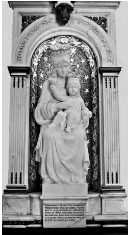
La statue de Notre-Dame-de-la-Recouvrance, à l'entrée de la nef de la basilique-cathédrale, rappelle l'église que fit construire Champlain, en 1633.

5 004 personnes. La cathédrale, vétuste, est devenue trop petite pour répondre aux besoins des offices dominicaux. À compter de 1745, Jacrau a donc à surveiller un important chantier de construction. La cathédrale, considérablement agrandie, prend les dimensions qu'on lui connaît aujourd'hui.