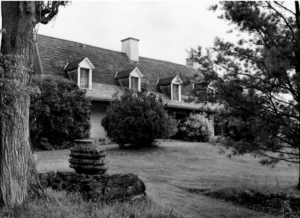
Vue actuelle de l'habitation du Domaine Pointe de Saint-Vallier.