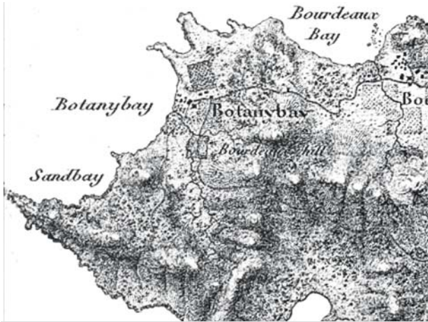
Botany Bay en Australie. Carte de l'établissement en 1834-1839. ( http://www.stjohnhistoricalsociety.org/Articles/BotanyBayEstate.htm ).

Dans un éditorial d'août 1839, de concert avec les pressions privées qu'exerçait depuis le début de la décennie la North American Colonial Association à Londres,