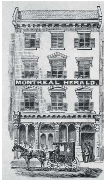
John Henry Walker (encre sur papier et gravure sur bois). Le siège social du Montreal Herald de 1850 à 1885. (Musée McCord).

Jusqu'au basculement du conflit politique bas-canadien dans la violence insurrectionnelle armée, l'accusation de déloyauté était réservée, pour les rédacteurs du Montreal Herald , aux « démagogues » à la tête du parti patriote, les paysans demeurant pour eux, une masse crédule, indigente, sans ambition, ignorante au fond des véritables enjeux que suscitait la lutte de prépondérance entre le parti majoritaire à la Chambre d'assemblée et la « phalange des vingt mille homme libres » ( Herald Abstract , 17 novembre 1836) dans le Haut et le Bas-Canada. Le soutien populaire armé dans le camp patriote marque l'extension de l'accusation de déloyauté à l'ensemble de la population canadienne. Or, fait remarquable, dans le Montreal Herald , le registre d'incompatibilité entre les deux communautés nationales