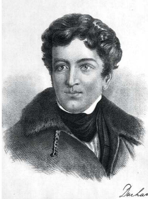
John George Lambton, lord Durham (1792-1840).

Les efforts avortés des tories en vue de criminaliser les insurgés patriotes de 1837 seront couronnés de succès en 1839 à la suite de l'échec de la deuxième insurrection. Étant « le plus noir et le plus ténébreux de tous les crimes politiques » ( Herald Abstract , 25 novembre 1837), la rébellion appelle ainsi, selon eux, une expiation collective. Aussi, en juillet 1839,