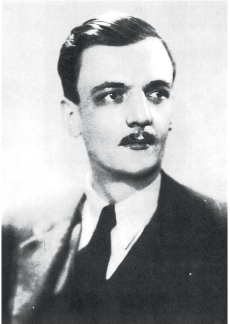
André Laurendeau (1912-1968), journaliste et homme politique, directeur de l' Action nationale (1922-1954), directeur et rédacteur en chef du Devoir.

Après 1763, la métropole britannique cherche un appui aristocratique et religieux dans sa nouvelle colonie d'Amérique du Nord. Elle compte sur les seigneurs de la colonie comme sur un pouvoir aristocratique, tout comme dans son système nouveau à l'époque de monarchie constitutionnelle, elle fait perdurer le pouvoir royal, le pouvoir aristocratique de la chambre des Lords à côté du pouvoir démocratique de la Chambre des communes. La métropole, qui s'appuie sur l'Église anglicane, est capable de voir dans l'Église catholique de la colonie une alliée possible, qui partage ses valeurs monarchiques, mais dont elle doit s'assurer de la loyauté en rendant son existence conditionnelle à son loyalisme.