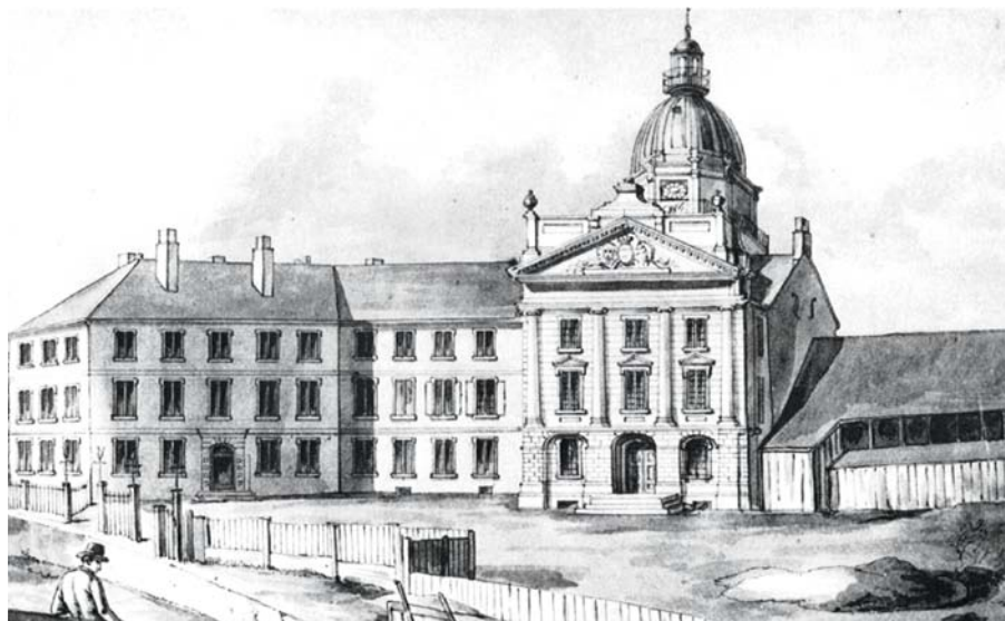
Édifice du parlement à Québec, vers 1850. Aquarelle de A. Kollner. (Bibliothèque et Archives Canada).

L'un de ses contemporains, le jeune écrivain André Major, a formulé la chose plus radicalement au moment de la guerre d'Algérie dans La Revue socialiste , revue la plus à gauche de l'époque : « Disons que le régime colonial français