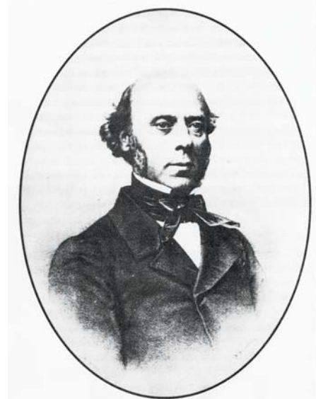
François-Xavier Garneau (1809-1866).

perceptible avec le premier recensement officiel du Canada-Uni en 1851 où il est devenu évident que dorénavant, au Canada-Uni même, la population anglophone dépasse la population francophone. Entre-temps, Londres avait fourni un autre exemple de ce dont elle était capable en matière de colonialisme :