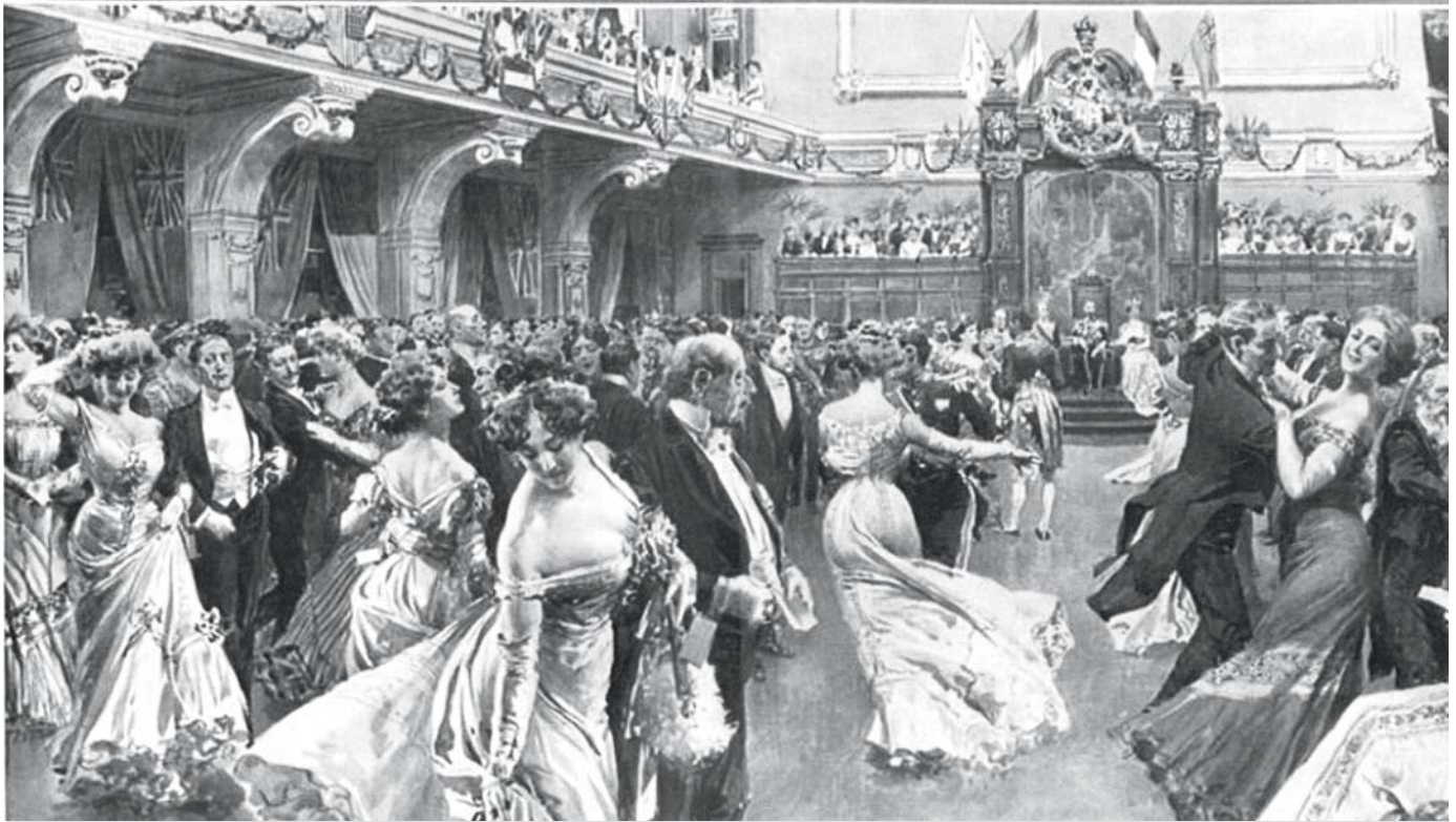
Les bals, les banquets et les thés constituent trois des activités où les différentes élites de Québec se croisent fréquemment. En 1908, à l'occasion du tricentenaire de la ville, bon nombre des festivités prévues pour l'occasion rassemblent anglophones et francophones. Le Canadien mentionne d'ailleurs, le 1 er août, que les Canadiens français sont « flattés » que « les Anglais prennent très largement part à nos fêtes » parce qu'ils « sont unis à nous par des liens d'amitié et d'intérêt. » (Bal tenu le 28 juillet 1908 à l'Assemblée législative en l'honneur du prince de Galles).