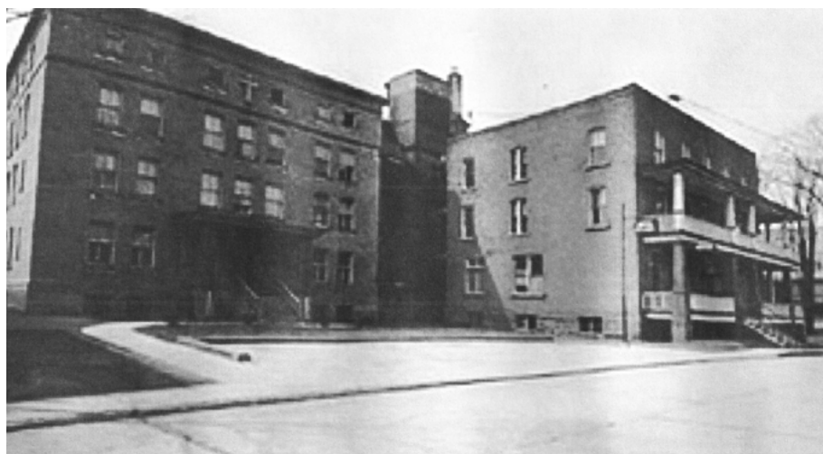
Hôpital Sainte-Croix, rue Brock, en 1943. ( http://www.csssdrummond.qc.ca/Web/Page.aspx?Id=159 ).

Le cas de Drummondville est surtout très instructif pour comprendre l'organisation des mesures d'assistance par les élites