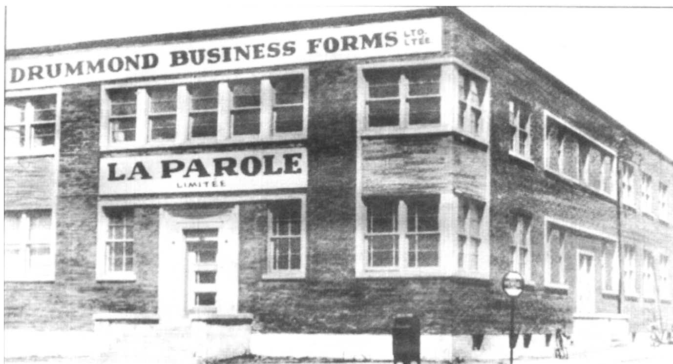
Édifice du journal La Parole , situé à l'époque au 440, rue Hériot (Fonds La Parole, Société d'histoire de Drummondville).

La mesure sociale privilégiée demeure cependant les travaux publics, qui consistent à rémunérer les chômeurs pour leur participation à de grands projets de construction et d'aménagement. Ici encore, c'est le conseil de ville qui définit les critères d'embauche des ouvriers, que ce soit pour les travaux publics ou les différentes industries de Drummondville. Pour ce faire, le gouvernement local met en place un