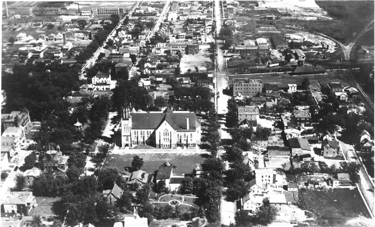
Vue aérienne du centre-ville de Drummondville, vers 1925-1930.