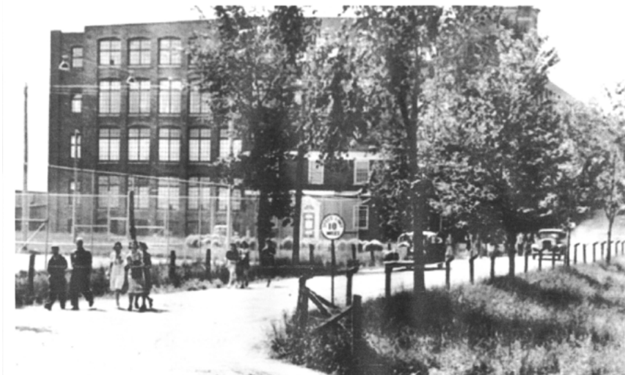
Usine Dominion Textile, vers 1940.

Le discours optimiste sur la situation économique de cette ville n'est pas totalement dépourvu de fondement. En effet, de 1929 à 1934, le nombre d'établissements industriels va presque doubler, passant de 16 à 28 (selon l' Annuaire statistique de la province de Québec ). Ce sont des entreprises liées au domaine du textile, dont quatre sur cinq exploitent la soie, qui embauchent le plus d'ouvriers. La présence de telles industries, moins touchées par les effets de la crise – la soie artificielle étant un nouveau produit très recherché –, expliquerait que Drummondville soit demeurée un centre industriel relativement prospère.