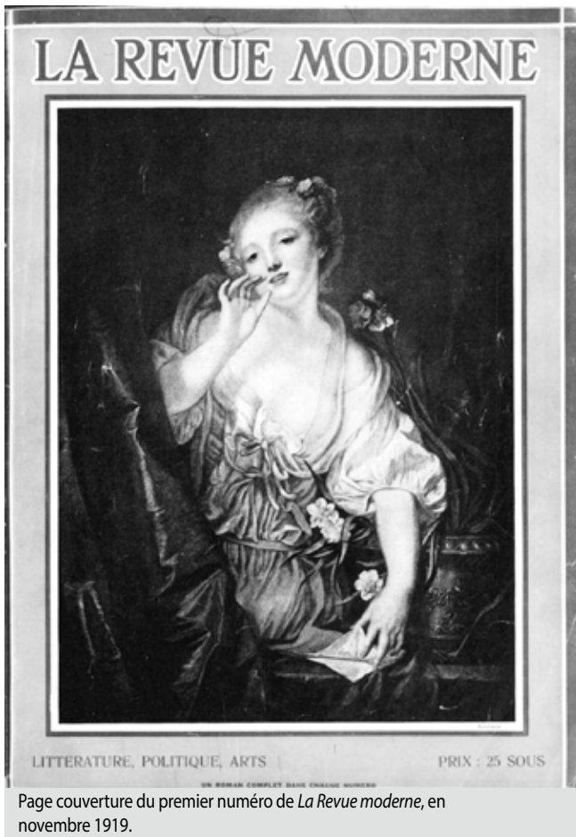
Page couverture du premier numéro de La Revue moderne , en novembre 1919.

comme des amies des bons et des mauvais jours; qu'elles soient les confidentes des unes, la consolation des autres, les conseillères discrètes de toutes ». Madeleine fait de même avec sa Revue moderne , qu'elle souhaite voir devenir « l'inspiratrice et l'amie ». Plus loin dans la revue, dans un texte intitulé « L'Entre-Nous », elle assure même personnellement à ses lectrices « la plus discrète, comme la plus intense amitié ». Gaétane de Montreuil, moins emphatique, présente quant à elle son magazine comme « un discret confident ».