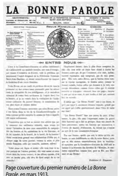
Page couverture du premier numéro de La Bonne Parole , en mars 1913.