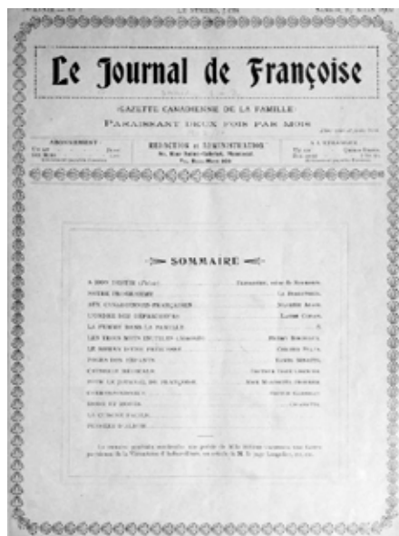
Page couverture du premier numéro du Journal de Française , en mars 1902.

tion des enfants, et bien sûr la myriade de produits de beauté, crèmes, pilules et autres remèdes pensés spécialement pour elles. À côté des annonces, les journaux publient des textes signés par des femmes, puis des chroniques écrites par et pour elles. S'ensuivent de complètes « pages féminines », ces feuillets hebdomadaires dans lesquels une journaliste offre quelques textes choisis, en plus de répondre aux questions des lecteurs, qu'il s'agisse d'affaires sentimentales, de littérature ou des règles d'étiquette. Sortes d'ancêtres du courrier du cœur, ces « réponses aux correspondants » propulsent la carrière des premières chroniqueuses-vedettes du Québec, celles-là mêmes qui deviendront trois des premières directrices de revues. Il s'agit de Française, nom de plume de Robertine Barry, qui dirige le