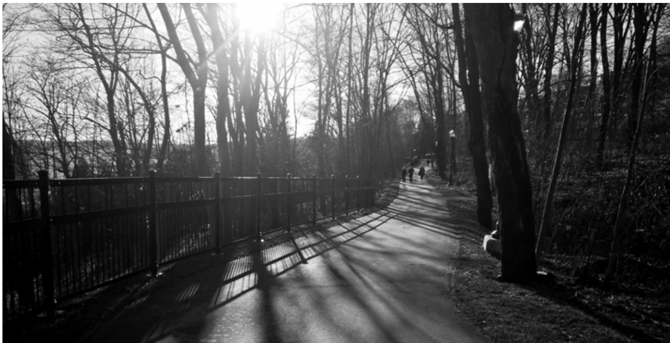
(Commission des champs de bataille nationaux).

La Commission des champs de bataille nationaux a annoncé le 1 er décembre dernier la fin des travaux d'aménagement du nouveau sentier des plaines d'Abraham, dont une bonne partie longe la côte Gil-