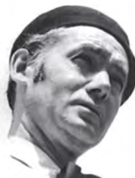
Le peintre Rodolphe Duguay. (1891-1973).

Élève de Marc-Aurèle de Foy Suzor-Coté, Rodolphe Duguay a séjourné à Paris de 1920 à 1927. Il est rentré ensuite à Nicolet, où il a voulu reconstituer l'intérieur de son atelier parisien. Inspiré par la nature qui l'entourait, l'artiste s'est imposé par ses paysages et ses gravures sur bois. Il a reçu l'Ordre du Canada en 1973 pour l'ensemble de son œuvre.