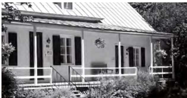
La maison et atelier Rodolphe Duguay à Nicolet. ( http://www.rodolpheduguay.com )

L'œuvre de l'artiste Rodolphe Duguay fera l'objet de plusieurs expositions en 2016. Né à Nicolet le 27 avril 1891, Duguay s'est fait connaître surtout comme peintre et graveur. La Maison et atelier Rodolphe-Duguay, institution vouée à la promotion de son œuvre et de celle qui a partagé sa vie, l'écrivaine Jeanne L'Archevêque, a préparé une programmation toute spéciale pour souligner le 125 e anniversaire de la naissance de l'artiste. Classé immeuble patrimonial, la maison construite en 1854, et l'atelier, ajouté en 1927, tiennent des expositions thématiques des œuvres de Duguay et présentent son mobilier et son matériel d'artiste. En cette année de commémoration, l'institution accueillera les visiteurs