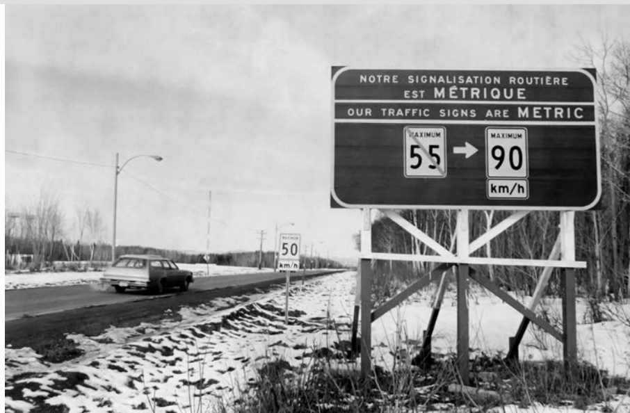
Panneau routier illustrant l'époque de la conversion au système métrique. (Archives du ministère des Transports du Québec).

Dans un article substantiel intitulé « Le numérotage des routes » qui fait la page couverture du Bulletin en juin 1926, on présente ainsi un nouveau système : « Depuis le début de la saison, les automobilistes ont remarqué sur un certain nombre de routes une plaque blanche sur laquelle est dessiné le contour de la feuille d'érable reproduit sur cette page et encadrant un ou deux chiffres. C'est là la plus récente addition faite par le ministère de la Voirie aux signaux routiers jusqu'ici en usage ». Selon ce système, la route 1 reliait Montréal à Sherbrooke; la route 2 unissait Montréal à Québec par la rive nord; la route 3 partait de Lévis jusqu'à Saint-Lambert. La route 9 entre Longueuil et l'État de New York était surnommée la route Édouard VII (en l'honneur du roi