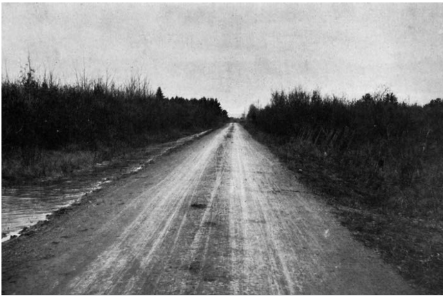
Chemin Maguire vers Sillery, 1913. Photographie tirée du Rapport du ministère de la Voirie de la province de Québec , Québec, E.-E. Cinq-Mars, Imprimeur du Roi, 1914.

Même si les rues et les routes existaient bien avant la venue des premières automobiles, la signalisation routière au Québec a connu une mise au point rapide en l'espace de seulement quelques années, principalement au début des années 1920, afin de répondre au nombre toujours croissant de véhicules motorisés. Pour l'historien, la lecture du Bulletin officiel du ministère de la Voirie , publié deux fois par mois (sauf en hiver) à partir de 1923, permet de suivre pas à pas cette évolution. Chaque Bulletin fournit une mine d'informations sur la circulation routière de l'époque et nous permet de cerner l'évolution des actions du Ministère dans le domaine de la signalisation. Presque chaque édition