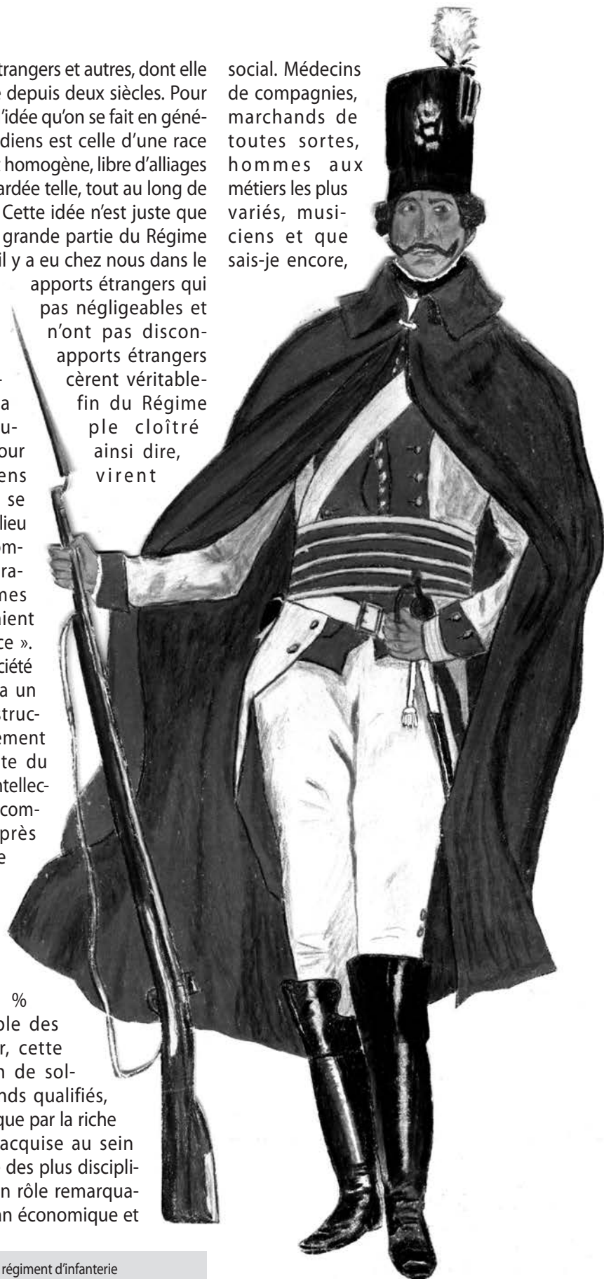
Mousquetaire du régiment d'infanterie d'Anhalt-Berbst.

social. Médecins de compagnies, marchands de toutes sortes, hommes aux métiers les plus variés, musiciens et que sais-je encore,