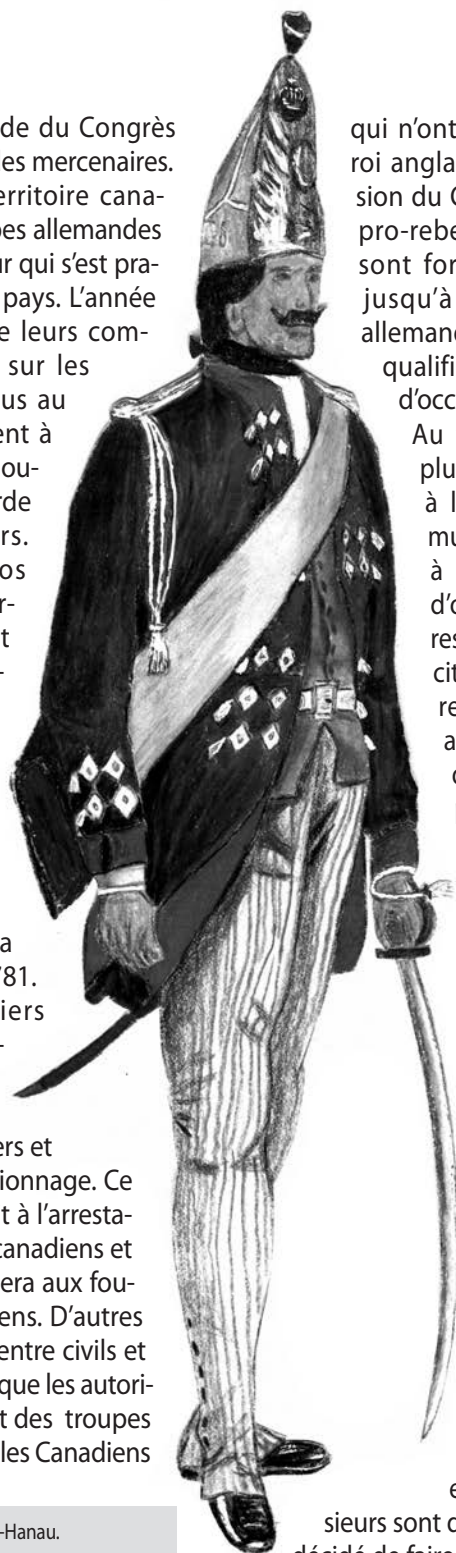
Grenadier du régiment de Hesse-Hanau.

de La Fayette, à la solde du Congrès américain, qui étaient des mercenaires. Dès leur arrivée en territoire canadien, en 1776, les troupes allemandes repoussent l'envahisseur qui s'est pratiquement emparé du pays. L'année suivante, pendant que leurs compatriotes s'exécutent sur les champs de bataille plus au sud, d'autres participent à de nombreuses escarmouches en assurant la garde des postes frontaliers. Leur présence en nos murs devient si importante qu'ironiquement le gouverneur Haldimand, dans une correspondance à lord Germain, souligne que son armée anglaise au Canada est composée en majeure partie d'Allemands. Cette situation prévaudra d'ailleurs de 1779 à 1781. À l'heure des premiers quartiers d'hiver, certains d'entre eux sont appelés à jouer des rôles difficiles de policiers et d'agents de contre-espionnage. Ce travail ingrat les conduit à l'arrestation de sympathisants canadiens et américains et les exposera aux foudres de certains historiens. D'autres difficultés surviennent entre civils et soldats allemands alors que les autorités coloniales se servent des troupes allemandes pour mater les Canadiens