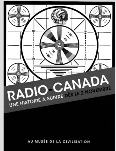
Radio-Canada, une histoire à suivre. Musée de la civilisation de Québec.

http://www.mcq.org/fr/mcq/expositions.php