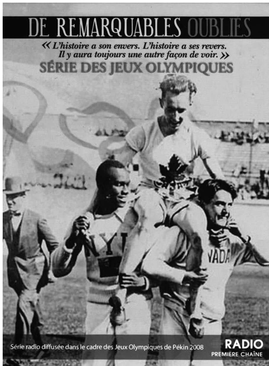
(Collectif) De remarquables oubliés. Série des Jeux olympiques. Société Radio-Canada (Radio Première Chaîne) et Distribution Sélect. Coffret 5 disques sur CD, 2010. SRCCD-2341-1 à 5.

http://www.radio-canada.ca/radio/profondeur/remarquablesoubliés/person-nages.htm