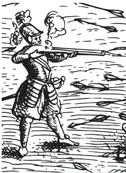
« Défaite des Yroquois au Lac de Champlain », repris de l'œuvre Voyages de Champlain (1613). Cet autoportrait est la seule image contemporaine de l'explorateur. Peut-être le seul véritable portrait de Samuel de Champlain tel que dessiné par lui-même.

S amuel de Champlain, quel personnage historique fascinant! Le héros d'un mythe. Un être extraordinaire en voie de redevenir un homme. Il est paradoxal, à la fois connu mondialement pour ses exploits comme explorateur et administrateur colonial et entouré de mystère. Il s'est forgé une renommée grâce à ses cartes et ses récits de voyages en Amérique du Nord-Est, sa description de la fondation de l'île Sainte-Croix (Dochet Island, Maine) et de Port-Royal (Annapolis Royal, N.-É.) en 1604-1607 et de Québec en 1608-1632. Mais l'homme reste très discret sur sa vie privée et difficile à cerner, énigmatique. Il en résulte que plusieurs facettes de son histoire sont encore méconnues et alimentent des recherches et des débats parmi les historiens. Était-il noble de naissance? Pourquoi a-t-on autant tardé avant d'analyser ses dires et ses actions et de mettre en doute ses écrits? Pourquoi les Canadiens français puis les Québécois, les Canadiens, les Français, les États-Uniens se sont autant identifiés à lui? Peut-on le qualifier de fondateur unique de Québec et de la Nouvelle-France? Était-il humaniste? Où sont ses archives personnelles? Où son tombeau se trouve-t-il? Pourquoi la société québécoise, qui connaît autant ce fondateur et qui rappelle sa mémoire par tant de livres, de lieux, de bâtiments et de monuments, qui lui doit tant,