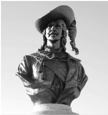
Monument de Pierre Dugua de Mons, par Hamilton MacCarthy, érigé en 2007, sur l'avenue Saint-Denis, près de la citadelle de Québec. ( https://fr.wikipedia.org/wiki/Pierre_Dugua_de_Mons ).

des êtres inférieurs, des « sauvages » que Champlain et ses contemporains (et par extension les Canadiens français) étaient venus « civiliser ». Ce récit a eu des conséquences néfastes considérables sur la connaissance de l'histoire du début du XVII e siècle. Pendant longtemps, on a ignoré les faits suivants. Une alliance franco-montagnaise scellée près de Tadoussac en 1603 a rendu possible la fondation de Québec en 1608. Le roi Henri IV a demandé et obtenu la permission d'envoyer des hommes en territoire montagnais. C'est Henri IV qui a élaboré la politique d'alliances de la France avec les « princes » autochtones et non pas Champlain. Il reconnaissait que les autochtones formaient des « peuples » et des « nations », comme Champlain dans ses récits. Champlain et les chefs alliés se disaient « frères ». Les environs de Québec n'étaient pas inhabités et il y avait une cohabitation. Les Montagnais-Innus nommaient Québec « Uepishtikueiau » (j'en connais qui le nomment encore ainsi). Le toponyme Québec serait issu d'un malentendu (de « kapak » en innu aimun, qui signifie « débarquez », et non « là où la rivière rétrécit » (« uepishitkueiau »)... J'ai étudié le déni de la contribution amérindienne à la fondation dans d'autres recherches. Pour des raisons pratiques, je n'y reviens pas ici. Il en va de même pour la contribution cruciale