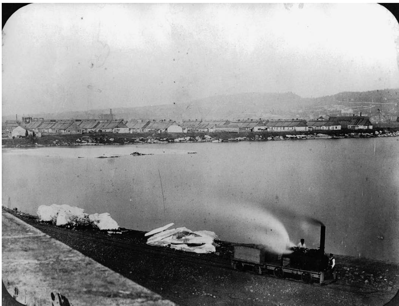
Sheds de Pointe-Saint-Charles depuis le haut du pont Victoria, Montréal, Qc, 1858-1859.

dais fuyaient la grande famine, qui touchait leur pays d'origine depuis 1845. Les mauvaises conditions de traversée dans les voiliers et le pou de corps, vecteur de la maladie, ont contribué à transporter une épidémie de typhus au Canada-Uni. Cette maladie, caracté-