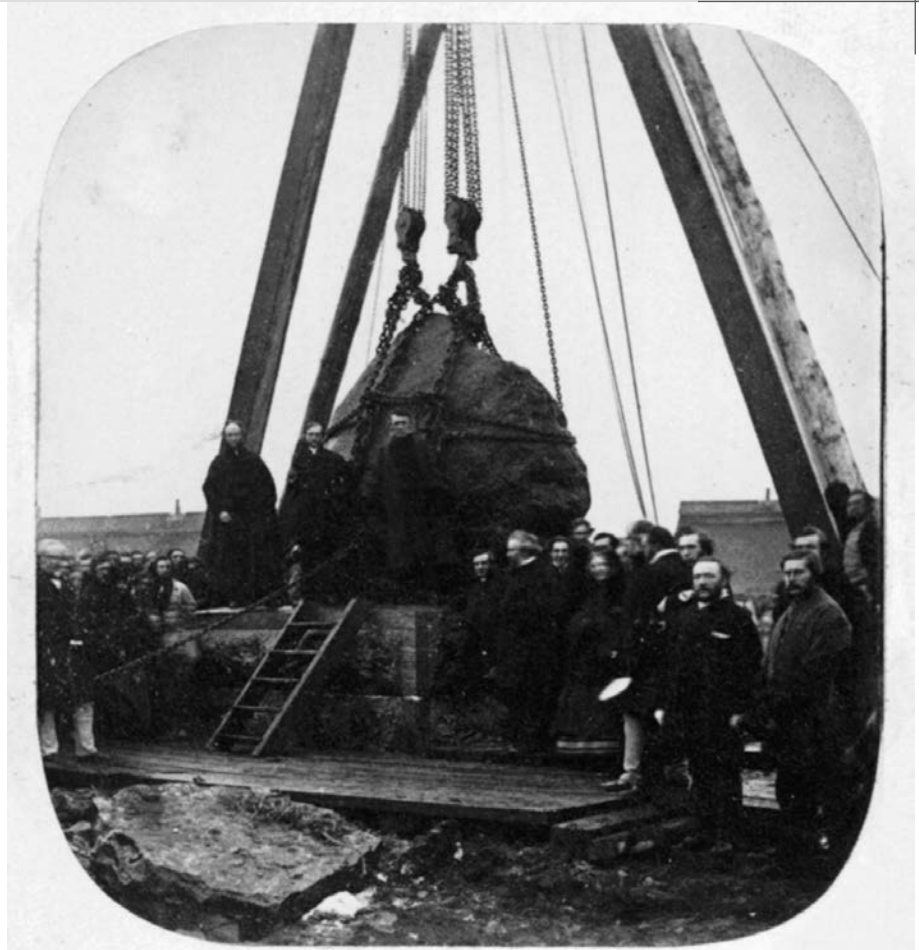
Pose de la pierre du monument marquant les tombes de 6 000 immigrants, pont Victoria, Montréal, Qc.

Une importante autorité est revenue aux communautés religieuses lorsqu'elles ont été choisies pour travailler aux sheds . En effet, les médecins étaient beaucoup moins nombreux que les sœurs et ces dernières étaient plus à même de savoir ce dont les immigrants avaient besoin parce qu'elles les côtoyaient quotidiennement. Les religieuses avaient donc une grande