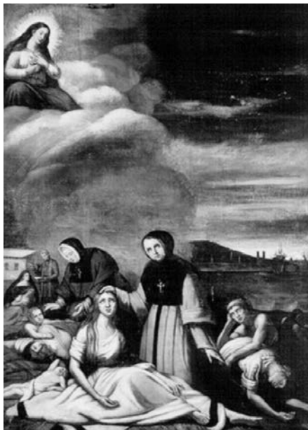
Théophile Hamel. Le Typhus , huile sur toile, vers 1849. (Musée Marguerite-Bourgeoys).

C'est dans ce contexte que les institutions charitables religieuses et laïques, qui avaient une longue tradition d'action lors d'épidémies, entrèrent en jeu. En effet, le rôle joué traditionnellement par l'Église catholique au Canada la désignait d'emblée pour s'occuper des malades. De plus, l'idéologie ultramontaine en pleine ascension, prônant la suprématie du clergé sur la société civile, justifiait l'emprise de l'Église sur les soins de santé. Par ailleurs, l'Église catholique connaissait, à partir des années 1840, un regain de popularité accompagné d'un renouveau de ferveur, ce qui lui permit de doubler l'effectif des communautés religieuses féminines (Dickinson et Young, p. 159). « [Cela] fournit une véritable armée de travailleurs sociaux religieux à la population catholique grandissante de la ville. » (Bradbury, p. 151). À Montréal, cette période correspond à l'arrivée (1840) à la barre de l'évêché d'un pionnier de l'ultramontanisme au Canada, M gr Ignace Bourget (Hamelin et Voisine, p. 71). Ce dernier ne se fit pas prier pour engager les ordres religieux dans le soin des malades irlandais.