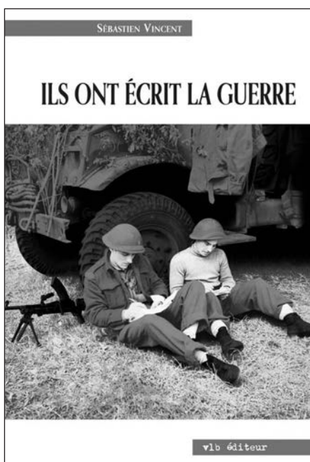
Sébastien Vincent. Ils ont écrit la guerre. La Seconde Guerre mondiale à travers des écrits de combattants canadiens-français. Montréal, VLB éditeur, 2010, 320 p.

Autant en Asie qu'en Europe, les prisonniers canadiens-français ont dû évoluer