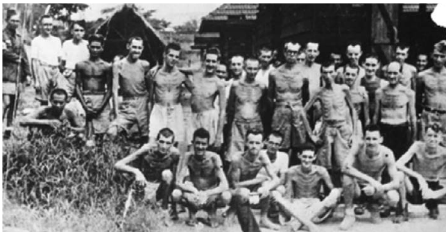
« Les corps décharnés des Canadiens fait prisonniers par les Japonais démontrent le calvaire qu'ils ont enduré ».