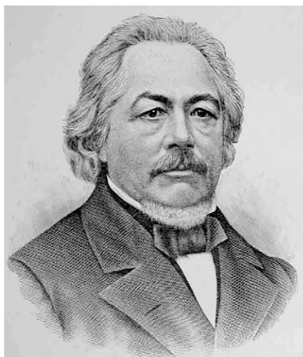
ÉTIENNE PARENT, Journaliste.

C'est à Étienne Parent que l'on doit les premières réflexions sur l'économie sociale. Homme politique, journaliste et fonctionnaire, Parent a été proche des patriotes avant que ceux-ci ne se radicalisent au milieu des années 1830. Acceptant pragmatiquement l'Acte d'Union de 1840, Parent se fait ensuite l'un des principaux théoriciens du nouveau nationalisme canadien-français de la survivance. Au milieu des