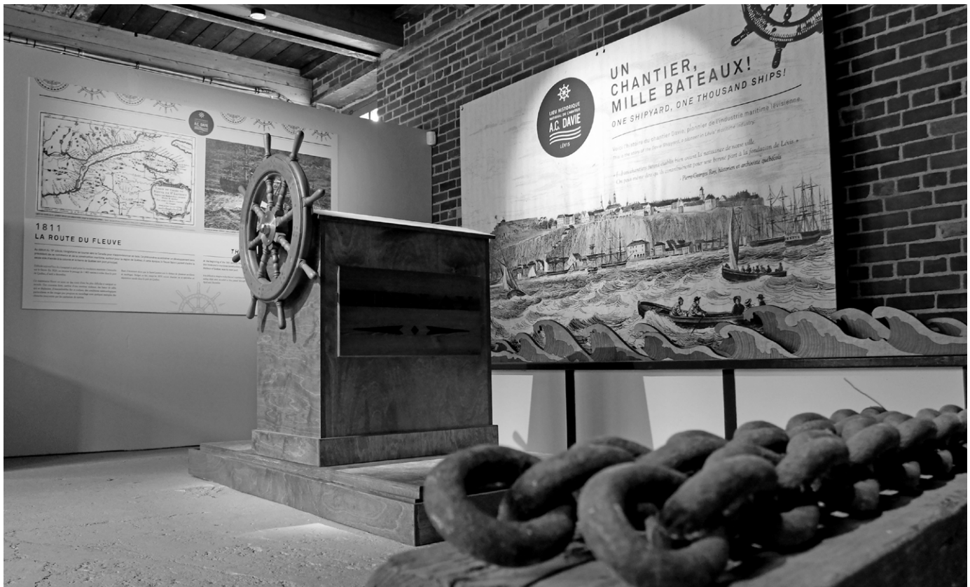
Entrée de l'exposition actuellement présentée sur le site. (Ville de Lévis).

bois, dont les « Gaspésiennes »; 50 spécimens de ces fameux bateaux seront lancés. En 1971, Logistec Corporation Ltd se porte acquéresse du chantier et le renomme Entreprises A.C. Davie en souvenir d'Allison Cufaude, le dernier des Davie à avoir dirigé l'entreprise familiale. Finalement, en 1987, Équimer en sera propriétaire jusqu'à sa fermeture définitive en 1989.