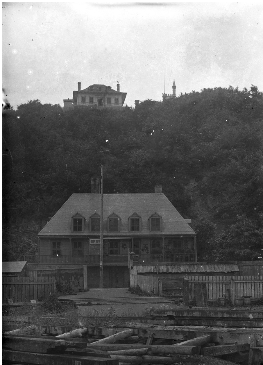
La maison Homestead vers 1910.

Chose promise, chose due. Davie s'associe à son beau-père dans ses activités de construction navale. En 1827, ils louent un emplacement sur rivière Saint-Charles, au pied de la côte de la Canoterie, où ils déménagent leur chantier du « Trou Saint-Patrick » de l'île d'Orléans. Avec le commerce du bois, le trafic maritime s'est considérablement accru sur le Saint-Laurent; par conséquent, la demande en réparation navale a augmenté d'autant. Déjà à cette époque, on compte plusieurs chantiers sur les rives de Québec, mais un navire en construction ne laisse pas beaucoup de place aux activités de radoub, d'autant plus que celles-ci ne peuvent généralement pas attendre. De plus, à cette époque, seule la Canada Floating Dock est spécialisée dans ce domaine. En 1829, pour répondre à cette demande spécifique, Taylor et Davie décident de diversifier