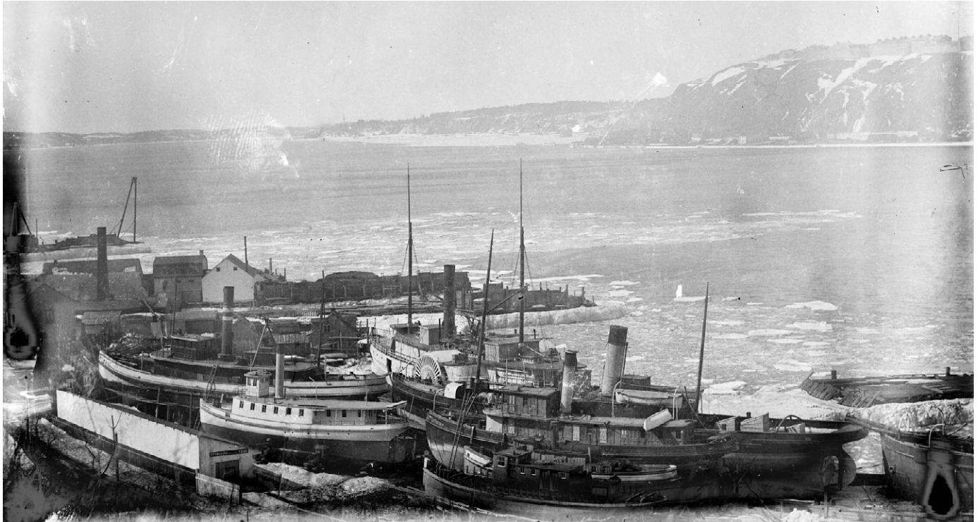
Hivernage de bateaux vers 1910.

jusant. Elle se vidait alors de son eau, elle était amarrée et lestée, et sa porte était fermée et calfatée. Le bateau pouvait ainsi demeurer au sec tout le temps qu'il fallait pour le réparer. Malgré leur efficacité relative, ces deux techniques étaient néanmoins dépendantes des marées.