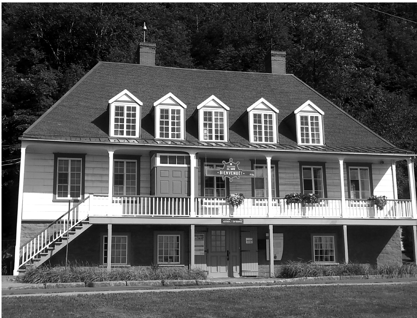
La maison Homestead aujourd'hui.