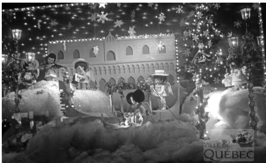
Vitrine du grand magasin Paquet sous le thème « féerie à saveur italienne », vraisemblablement dans les années 1960.

Avant de passer à table, intéressons-nous aux individus eux-mêmes. À quand remonte la présence italienne dans nos contrées? Il semble que les tout premiers individus originaires d'Italie soient arrivés ici en 1665, en tant que soldats du