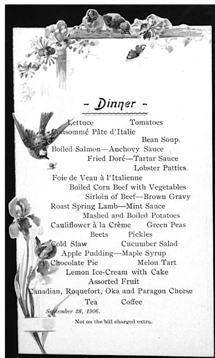
Menu du soir ( dinner ) de l'hôtel Clarendon à Québec, 28 septembre 1906, où apparaissent les mentions « Consommé pâte d'Italie » et « Foie de veau à l'italienne ». Ne nous leurrions pas : la présence de ces mets dits italiens, aux côtés de la surlonge de bœuf et de l'agneau en sauce à la menthe, ne reflète guère plus qu'une volonté d'offrir un menu « européen » à une clientèle touristique anglo-saxonne. (New York Public Library, The Buttolph collection of menus, image n° 473668. Domaine public).

civique, alors que bien des villes créent leur sauce « signature », comme alla bolognese ou napolitaine, des dénominations encore en usage aujourd'hui. Il faut être plus patient avant de voir arriver