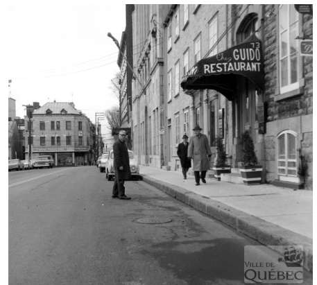
Restaurant Chez Guido, situé rue Sainte-Anne, entre les rues des Jardins et Chauveau (aujourd'hui rue Pierre-Olivier-Chauveau), dans le Vieux-Québec. On voit la caisse populaire Notre-Dame en arrière-plan.