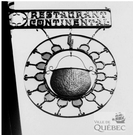
Le restaurant Continental, situé au 26, rue Saint-Louis, Québec, en 1967.

verbiaux « mets chinois canadiens », on voit émerger une cuisine italienne qui, tenant compte des goûts (et dégoûts) locaux, comporte de nombreux compromis destinés à la rendre plus conforme aux papilles québécoises. Ainsi, dans les recettes et les menus dits « italiens » des années 1950, bien peu des herbes et assaisonnements typiques de l'Italie figurent parmi les ingrédients! C'est le cas, entre autres, dans la seule recette de pizza relevée dans La Gazette en 1953. L'ail n'est présent que dans la moitié des recettes où il devrait normalement se retrouver. Si les ingrédients sont différents de la culture originelle, « l'esprit » de la préparation demeure. L'exemple de la sauce à spaghetti est remarquable puisque, quasi inconnue avant le milieu du XX e siècle, elle est rapidement devenue un incontournable du répertoire alimentaire québécois. Dans La cuisine raisonnée (l'un des livres de recettes les plus connus du Québec, qui célèbre d'ailleurs en 2019 son 100 e anniversaire), le spaghetti italien apparaît dans la 7 e édition, en 1954, puis s'y retrouve dans toutes les versions successives. On adapte le mets, on le transforme, parfois de manière inusitée. La cuisinière Five Roses propose en 1959 une recette consistant à casser des spaghettis en morceaux d'un pouce, de les cuire au bain-marie avec une boîte de soupe