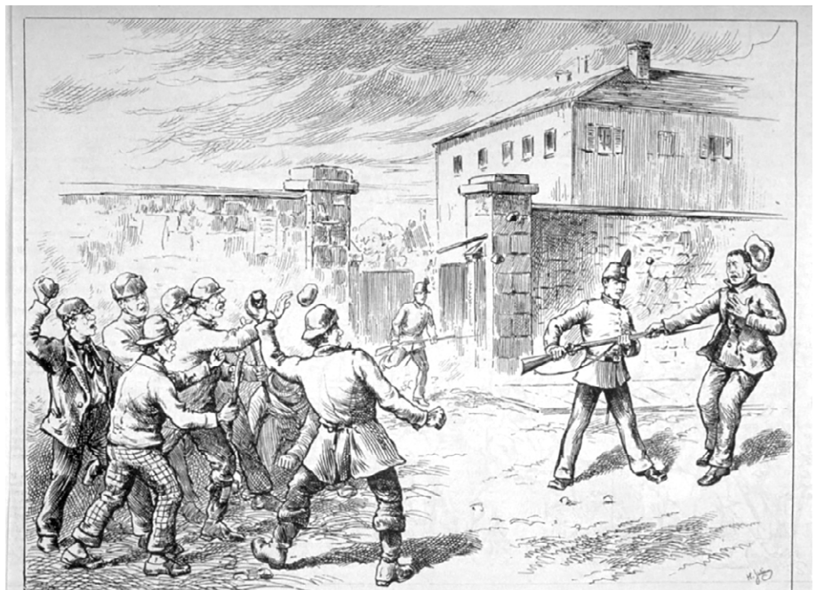
MONTREAL.—ATTACK ON A SENTRY OF THE MONTREAL CARBINIERS AT THE QUEBEC GATE BARRACKS. THE SENTRY, IN SELF-DEFENSE, PLUNGES HIS BAYONET IN THE BREAST OF ONE OF THE LEADERS AND KILLS HIM.

La construction des murs maçonnés au XVIII e siècle avait fixé de façon permanente la configuration de la trame urbaine à l'intérieur de la ville. Le projet d'aménagement présent en fixe la mor-