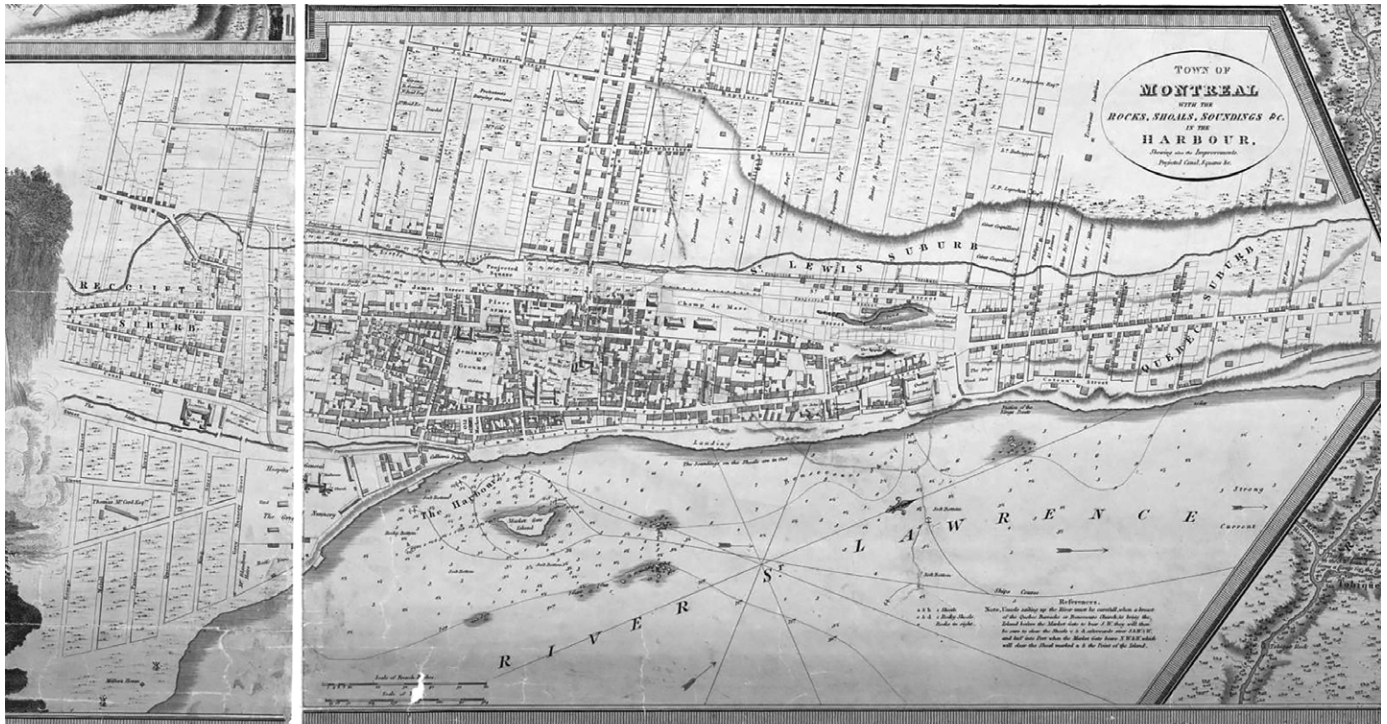
Portion de la carte de Montréal de Joseph Bouchette, 1815. (Archives de Montréal, CA M001 VM 066-3-P016).

sont situées. En effet, les lots confisqués pour la construction des murs et des glacis doivent être redonnés aux héritiers, s'il en reste afin qu'ils puissent en disposer à leur guise. Les projets de démolition constituent l'étape suivante. L'amélioration de l'efficacité et de la circulation étant considérée comme essentielle, les portes sont détruites en premier, puis les murs faisant face au fleuve, pour enfin terminer par les murs du côté nord. L'étape clé est toutefois celle de la planification urbaine. En effet, les commissaires sont mandatés par le gouvernement pour pourvoir à « la Salubrité, la Commodité et l'Embellissement » de la ville. Ainsi, alors que le centre connaît plutôt de petites rues sinueuses et engorgées, des avenues larges sont tracées sur les emplacements de plusieurs des murs, comme la rue des Commissaires (aujourd'hui la rue de la Commune), la rue Saint-Jacques et la rue McGill. Pour favoriser l'efficacité de la ville et en désengorger le cœur historique, deux nouvelles places de marché sont ouvertes. La première est la place des Commissaires (square Victoria) qui