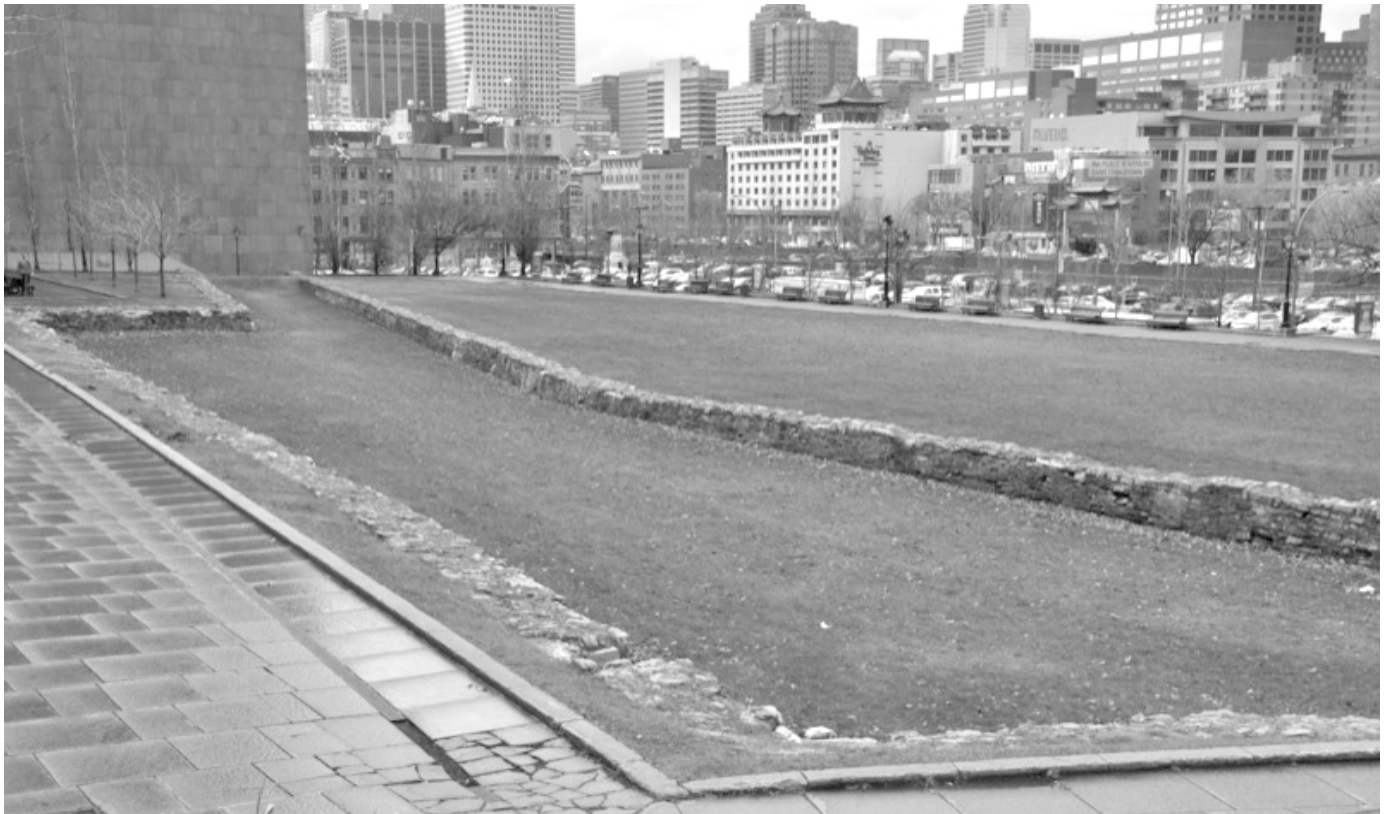
Traces actuelles des fortifications au Champs-de-Mars, Montréal. (Photo : Christian Lemire). http://www.patrimoine-culturel.gouv.qc.ca/rpcq/detail.do?methode=consulter&id=116983&type=bien#.XdQ62FdKi70

phologie tendant vers l'extérieur de la ville. Dans son propre projet de rénovation urbaine, New York développe un plan basé sur une grille orthogonale à partir de 1811. En lien avec les considérations d'aération et d'efficacité bien en vogue, en particulier aux États-Unis, les commissaires adoptent un plan similaire pour joindre les rues des faubourgs. Cette grille urbaine, quoique moins rigide que celle de New York, donne néanmoins un profil plus moderne à la ville tout en facilitant les futurs développements fonciers.