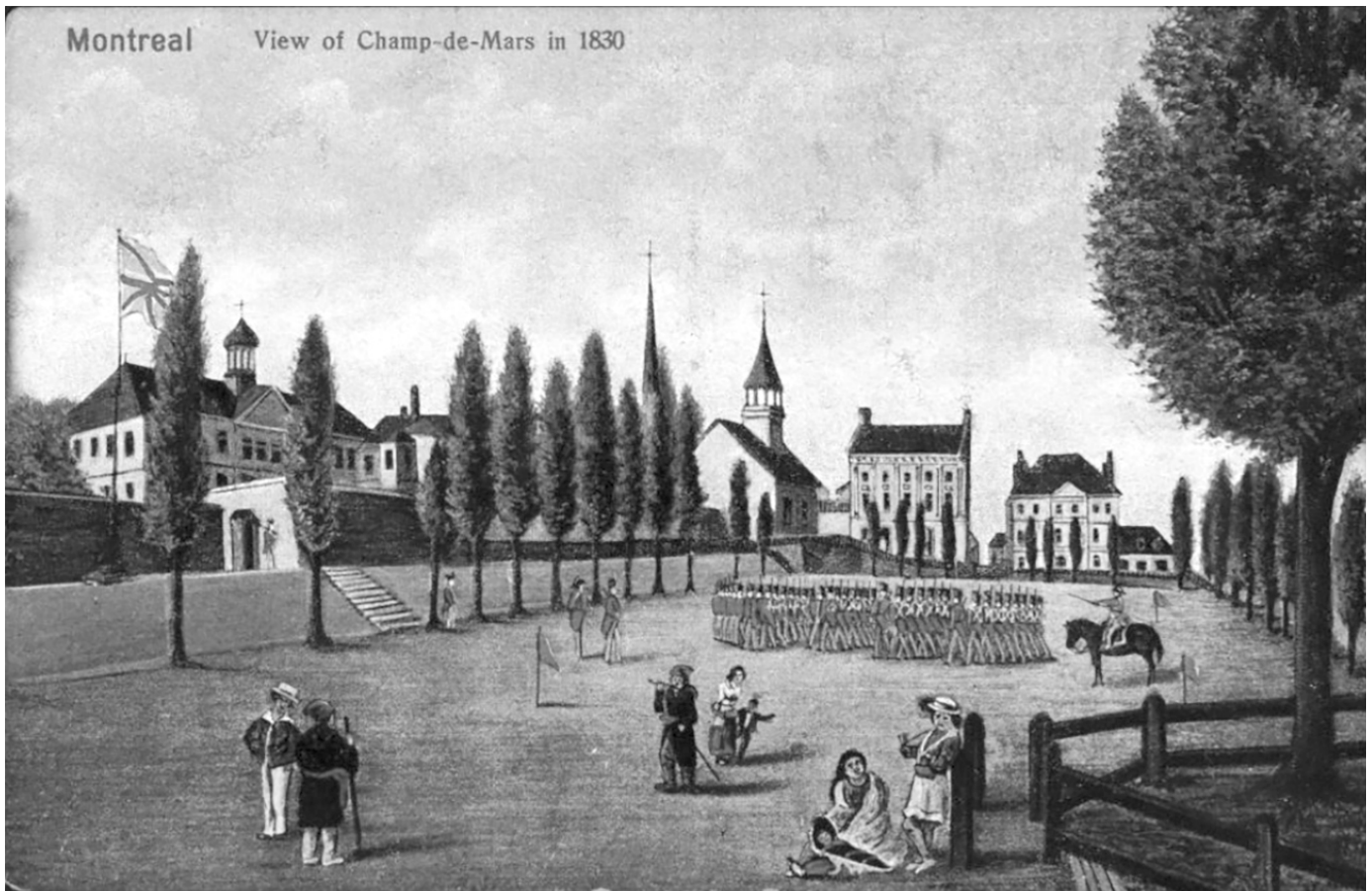
Montreal View of Champ-de-Mars in 1830