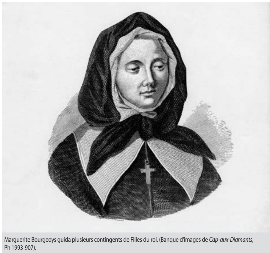
Marguerite Bourgeoys guida plusieurs contingents de Filles du roi..