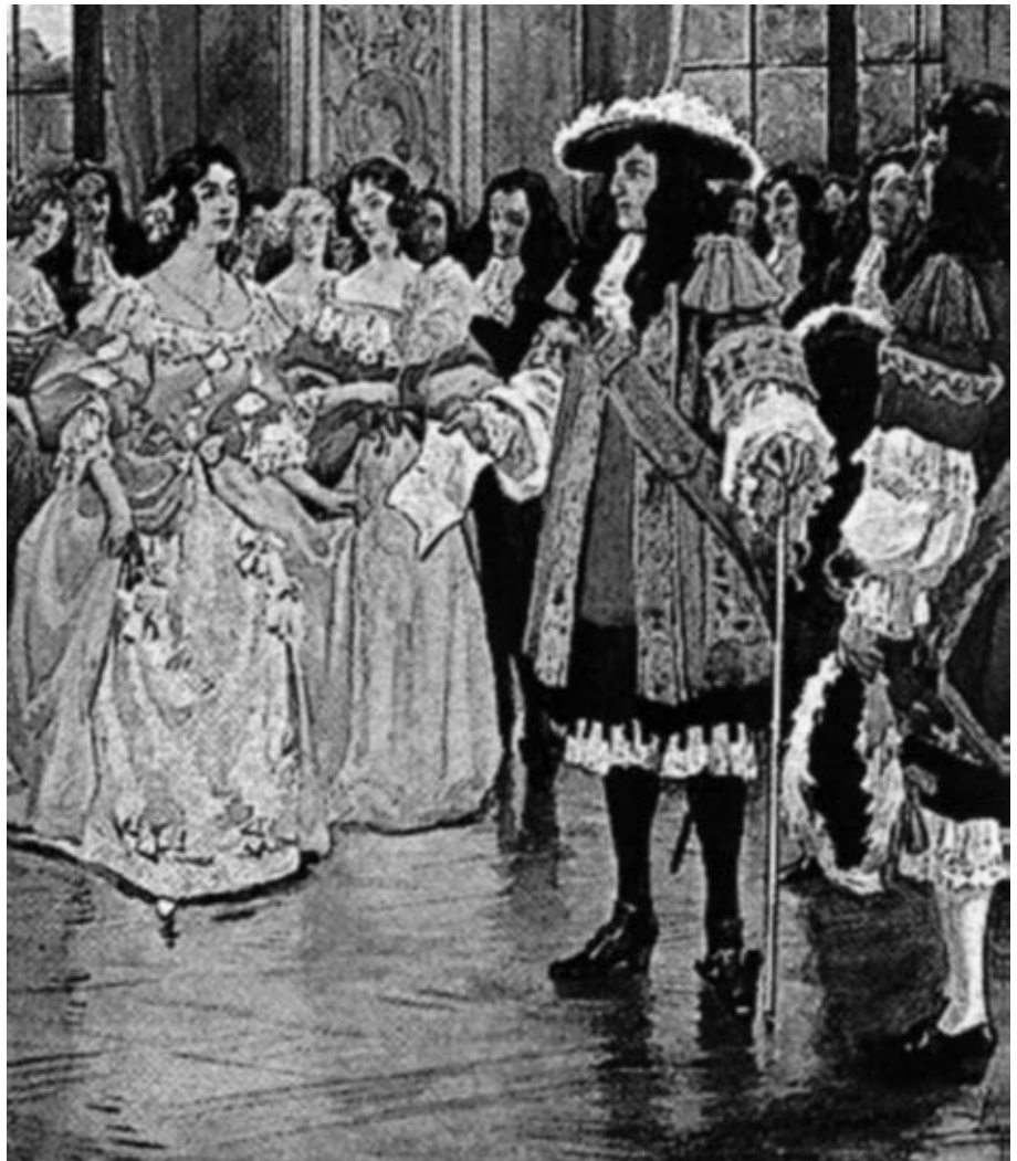
Aquarelle de Charles William Jefferys représentant Louis XIV recevant des recrues qui immigrent en Nouvelle-France.