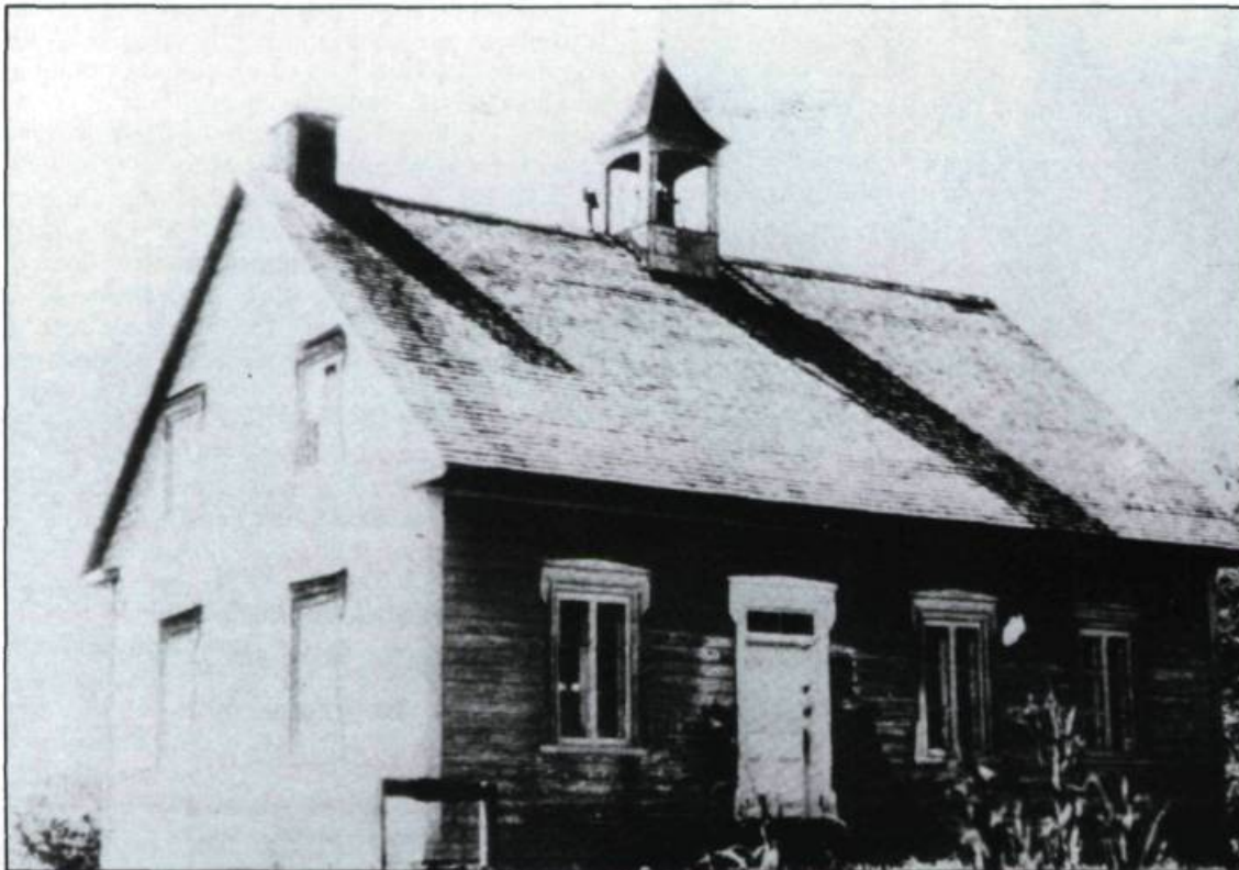
École de rang de Grondines dans le comté de Portneuf. (Jacques Dorion, Les écoles de rang au Québec, Montréal, 1979, p. 151).