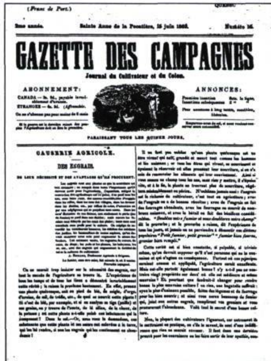
Page frontispice de la Gazette des campagnes (15 juin 1863). Né en septembre 1861, cet hebdomadaire renseignait et défendait la classe agricole. Il s'éteint en mars 1895.

Pour stimuler les élèves et les inciter à prendre leurs études au sérieux, la corporation de l'institution créée, en 1870, trois «sociétés littéraires»: l'Académie Saint-Thomas d'Aquin (cours classique) et l'Académie Saint-Louis de Gonzague (cours commercial) engagent leurs membres à bien se comporter et à travailler fort en classe. Chaque élève est admissible à l'académie de son cours s'il répond aux exigences demandées (succès scolaire). Les membres des deux sociétés sont tenus à donner annuellement deux séances publiques (lectures, exposés, débats, et autres activités). Ils peuvent aussi présenter une séance privée par mois. La troisième société, la Société Painchaud, veut instruire en amusant. Elle regroupe des étudiants qui discutent de leurs travaux, parlent de philosophie, d'histoire, de sciences et de littérature.