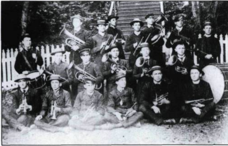
Fanfare du collège de Sainte-Anne-de-la-Pocatière, vers 1880.