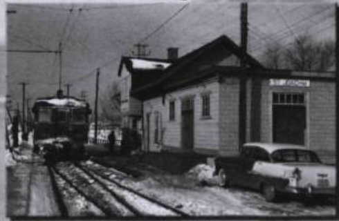
Cartes postales "Collection Art" Plus de 300 modèles disponibles