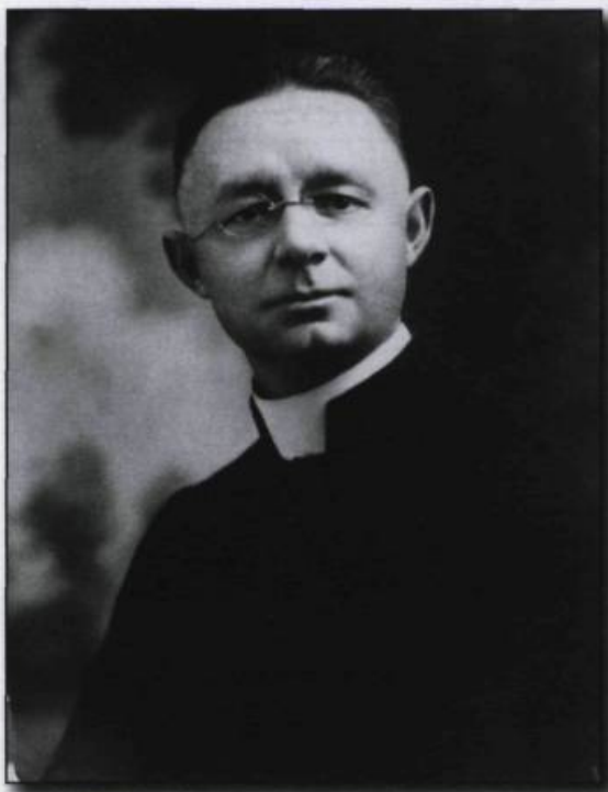
■ L'abbé Lionel Groulx (1878-1967), historien national. Carte postale sans date.

L'exode de Canadiens à la Conquête apparaît très complexe et diversifié. Certains sont partis par mobilité professionnelle. Au service du roi de France, des officiers de plume et d'épée sont passés en France avec épouses, enfants, beaux-parents, domestiques esclaves, etc. Ils ont quitté le Canada avec l'espoir que cette démonstration de leur loyauté et de leurs bons services serait vivement récompensé par un emploi intéressant en France. Des Canadiens de plus basse extraction sociale étaient également au service du roi et sont aussi partis avec leur famille pour les mêmes raisons : soldats mariés au Canada, sages-femmes « entretenues par le roi », pilotes et chirurgiens « du roi », employés spé-